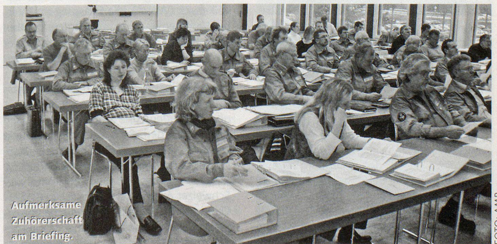
Aufmerksame Zuhörerschaft am Briefing.

Nationalrat Walter Donzé, Präsident des Schweizerischen Zivilschutzverbandes, besuchte den Kommandanten- und Zivilschutzstellenrapport. In seinen Grussworten dankte er den Zivilschutzkommandanten für ihr Engagement zum Schutz und zum Wohle der Aargauer Bevölkerung. Er ermunterte die Kommandanten, auch in Zukunft zur Weiterentwicklung des schweizerischen Zivilschutzes beizutragen, auch wenn dessen Akzeptanz und Anerkennung nicht überall gleich ausgeprägt seien. □