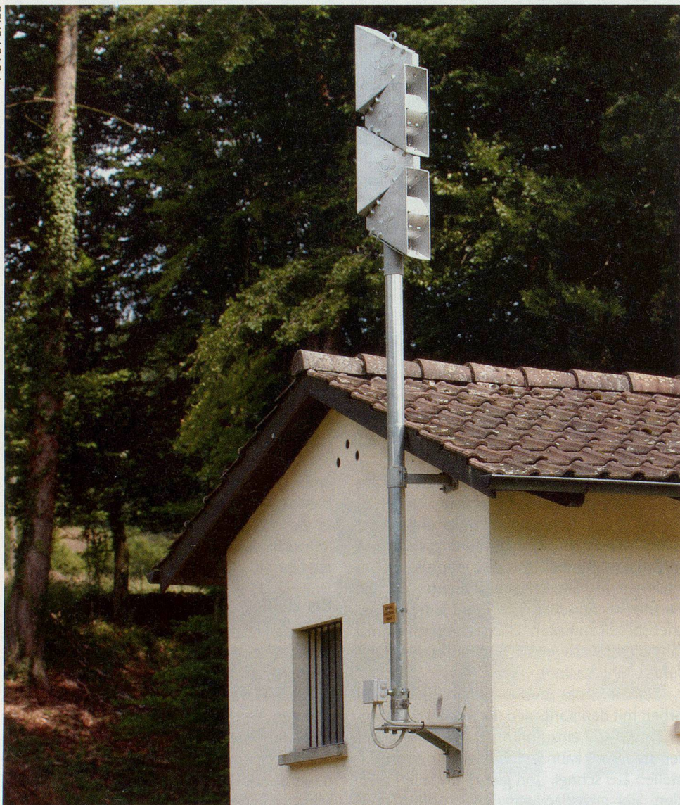
In der Schweiz gibt es zirka 4750 stationäre Sirenen, mit denen der Allgemeine Alarm ausgelöst werden kann – bereits heute in vielen Kantonen von zentralen Kommandostellen aus.