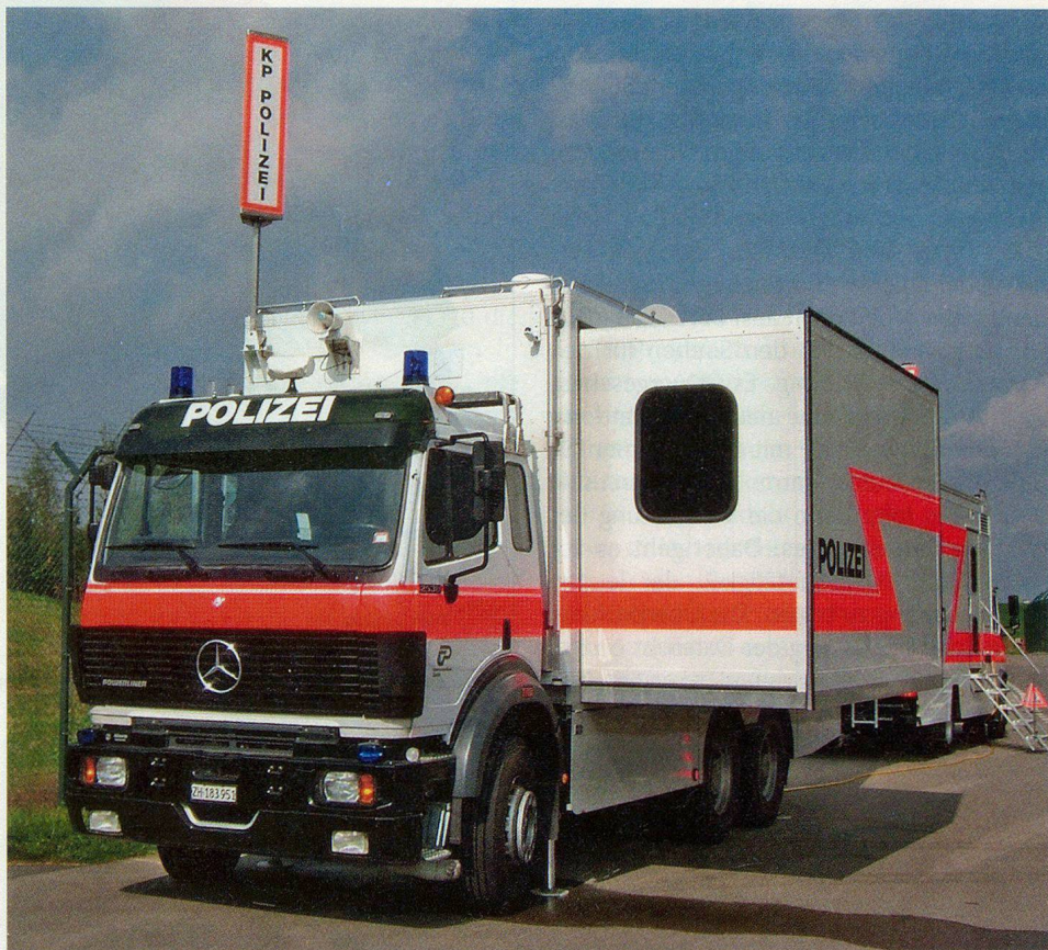
Einsatzführung mit modernsten Mitteln: Den Züspsa-Besuchern wird auch die mobile Einsatzzentrale MEZ der Zürcher Kantonspolizei offen stehen.

Wer sich besonders für den Bevölkerungsschutz interessiert, sollte die Züspsa am Samstag, 29. September, besuchen. Während des