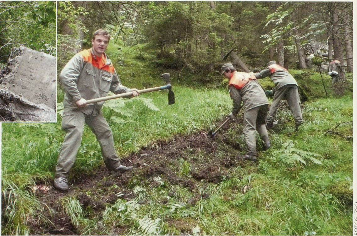
In teils unwegsamem Gelände zwischen Bristen und Silenen wird ein Weg angelegt.