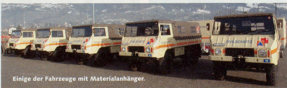
Einige der Fahrzeuge mit Materialanhänger.