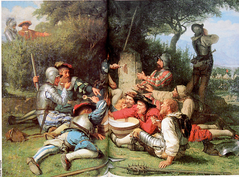
Symbol für die Identitätsfindung der Schweiz: die Kappeler Milchsuppe (Juni 1529) auf einem Gemälde von Albert Anker.

Das typisch Schweizerische an der Reformation Der Bauernsohn Zwingli ist hier vorsichtiger, demokratischer. In Zürich entscheiden nicht die kirchliche Obrigkeit oder Theologen über die Glaubenslehre. Unter Führung der Räte und Zünfte mutet sich hier die weltliche Gemeinde zu, Grundsatzentscheidungen zu fällen. Diese «helvetisch-demokratischen» Züge werden in Deutsch-