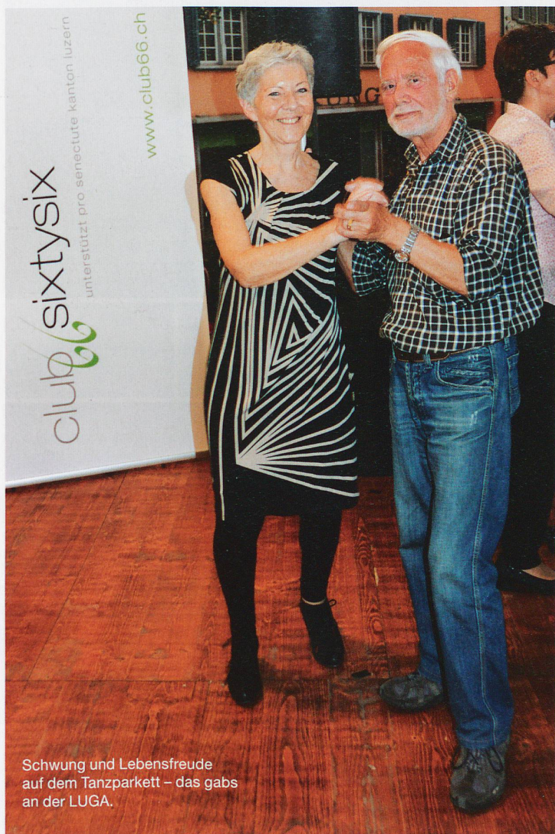
Schwung und Lebensfreude auf dem Tanzparkett – das gabs an der LUGA.

Interessante Referate und wertvolle Begegnungen: Das gabs an den Impulsnachmittagen sowie am Tanznachmittag und am Stand von Pro Senectute anlässlich der LUGA.