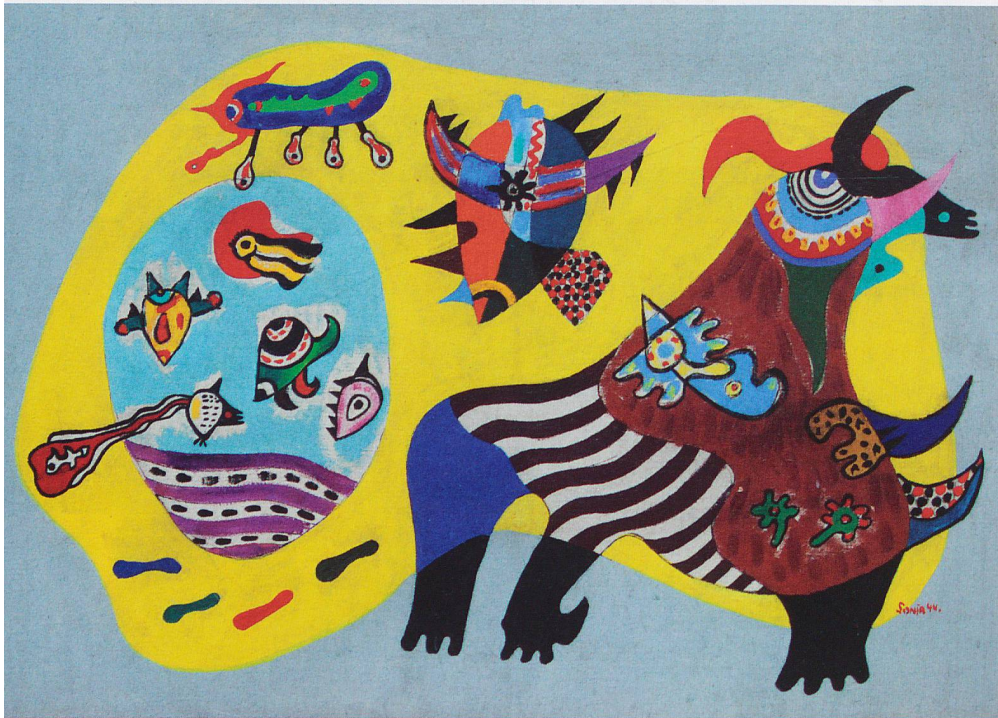
Sonja Sekula, «Animal Without Subject of War», 1944, Öl auf Leinwand, Kunstmuseum Luzern.