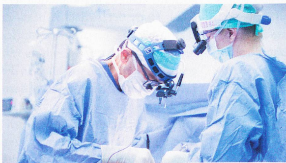
Xavier Mueller/Luzerner Kantonsspital

Ja, die gibt es. Ein Herzinfarkt ereignet sich eher selten wie ein Blitz aus heiterem Himmel. Oft deuten bereits vorher