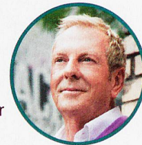
Moderation Kurt Aeschbacher