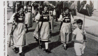
«Es geht bim Schiesse wie bim Wybe, s'git beidnen Orte g'fählt Schybe». Entlebucher Wyberschiessen 1939.

die Jesuiten schreibt, «welcher auf dem Fest zu Basel dermassen gewaltig rauschte, dass davon die Rede war, in corpore aufzubrechen und in den Festkleidern, den Festwein im Blute, hinzuziehen, um den Jesuiten das Loch zu verstopfen und ihre verrückte Theokratie zu zerstören».