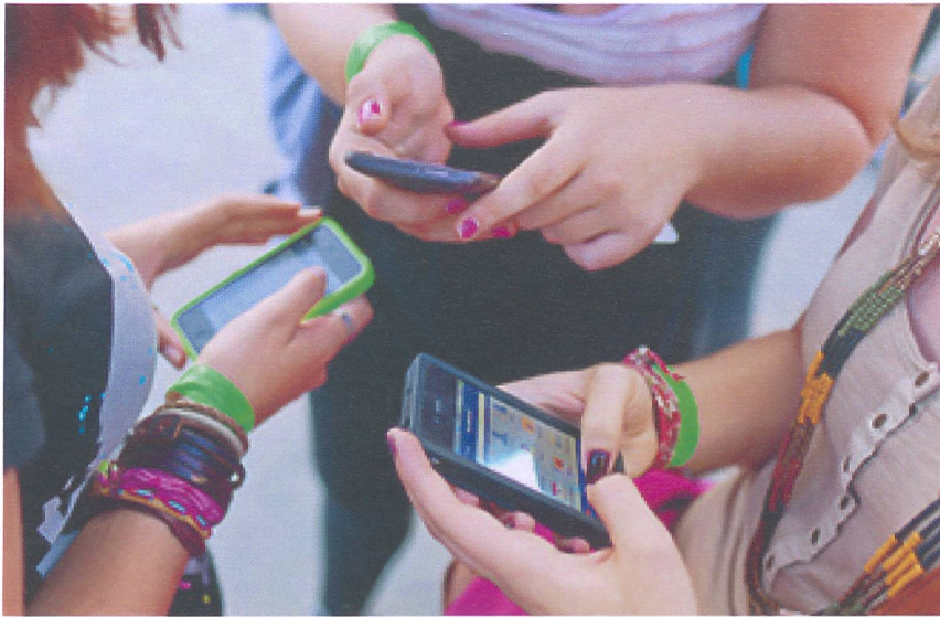
Schnell ist es passiert: Virtuelle Beleidigungen verbreiten sich rasant.