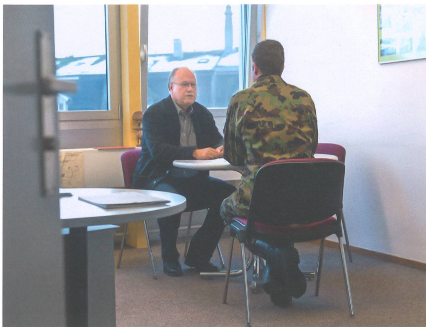
Im Büro in Bern gehen jährlich rund 5000 Anrufe mit Beratungsanfragen ein.

Andererseits seien die EO-Regelungen für viele komplex, räumt Läng ein. Deswegen versucht der SDA bereits am Orientierungstag beziehungsweise anlässlich der Rekrutierung anzusetzen: Die künftigen Rekruten werden mit Filmen und Broschüren ermuntert, sich rechtzeitig mit ihrer finanziellen Situation während der RS auseinanderzusetzen.