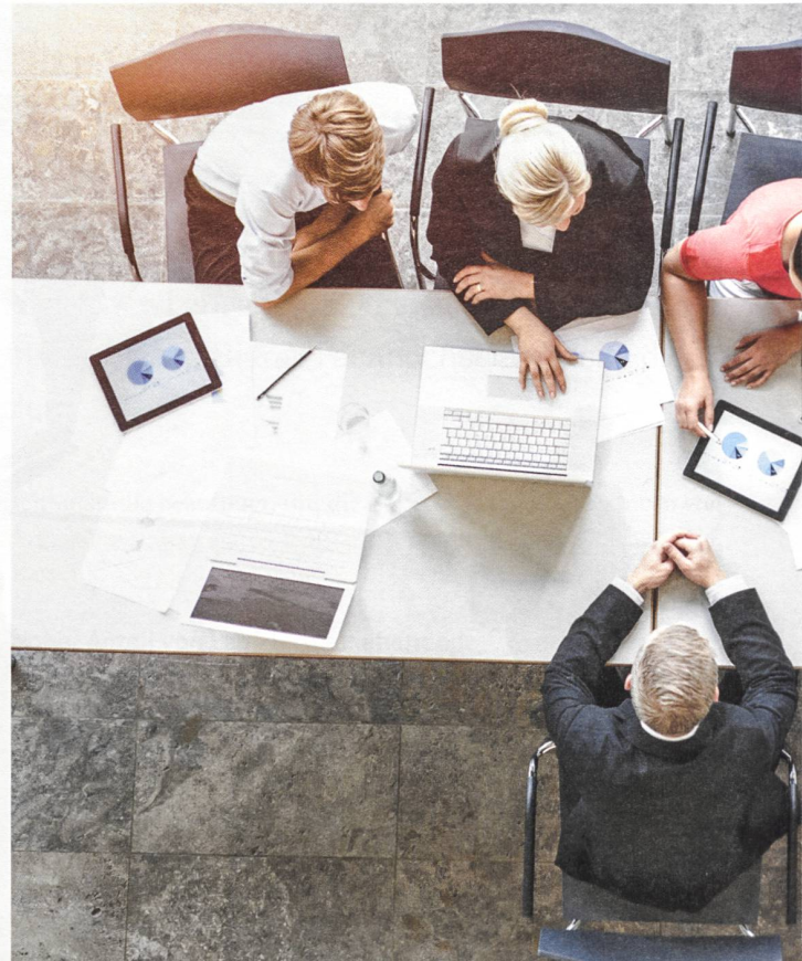
Findet ein älterer Stellensuchender wieder eine Stelle, muss er häufig erhebliche Lohneinbussen in Kauf nehmen.

Die schlechteren Erwerbschancen von älteren Arbeitslosen werden oft mit der geringeren Flexibilität und den veränderten Qualifikationsanforderungen auf dem Arbeitsmarkt aufgrund des technologischen Wandels in Verbindung gebracht. Zudem ist eine länger andauernde Arbeitslosigkeit mit einem Qualifikationsverlust verbunden. Als weiteres Argument werden höhere Lohnkosten insbesondere aufgrund der altersbedingten Staffelung der beruflichen Vorsorge angeführt. Die Ergebnisse zeigen aber, dass vor allem Personen ab 54 Jahren bei einem neuen Job erhebliche Lohneinbussen in Kauf nehmen müssen. Womöglich verzichten sie auf einen Teil des Lohneinkommens als Kompensation für die Pensionskassenbeiträge der Arbeitgeber. Im Durchschnitt liegt das Erwerbseinkommen bei älteren Personen 21 Prozent tiefer im Vergleich zur Beschäftigung vor der Arbeitslosigkeit und ihr Erwerbseinkommen ist deutlich tiefer als jenes der jüngeren Per-