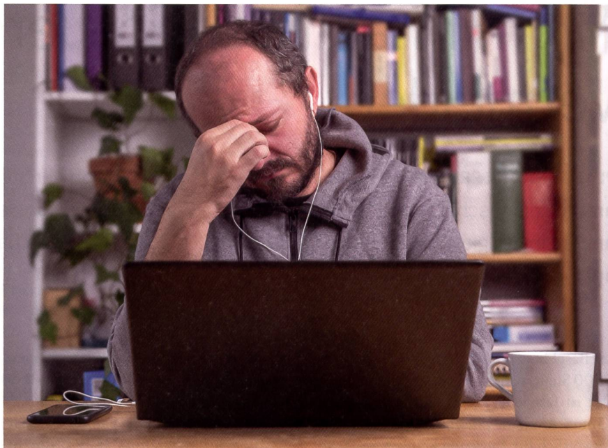
Trotz hoher Arbeitsbelastung wurden von einer grossen Mehrheit der Sozialarbeitenden Homeoffice und die Verwendung von digitalen Technologien geschätzt.

Auch die körperlichen und psychischen Beschwerden waren vergleichsweise hoch. Am häufigsten wurde über Schwäche, Müdigkeit und Energielosigkeit berichtet, wobei 29 Prozent stark und weitere 53 Pro-