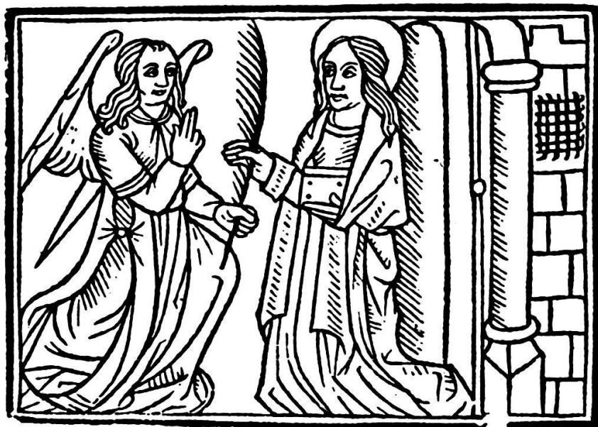
Constitutions de 1494, v o du feuillet du titre.

Incipiunt cōstitutiones synodales ecclesie z Episcopatus Lausannēsis. Per plures z diuer- sos presules lausannēsis edite. Et per reuerēn. in cristo patrē dominum Georgium de salucijs Ep̄m et comitē Lausannēsis cōpilare et in vñū volumen redacte. et demū. Per reuerēdissimuz In xpo p̄rem z dominū. Dnm Aymonē de mō te falcone dei gr̄a. presulem principē et comitez lausannēn. modernū cōfirmate et approbate. Ac de eius mādato impresse.