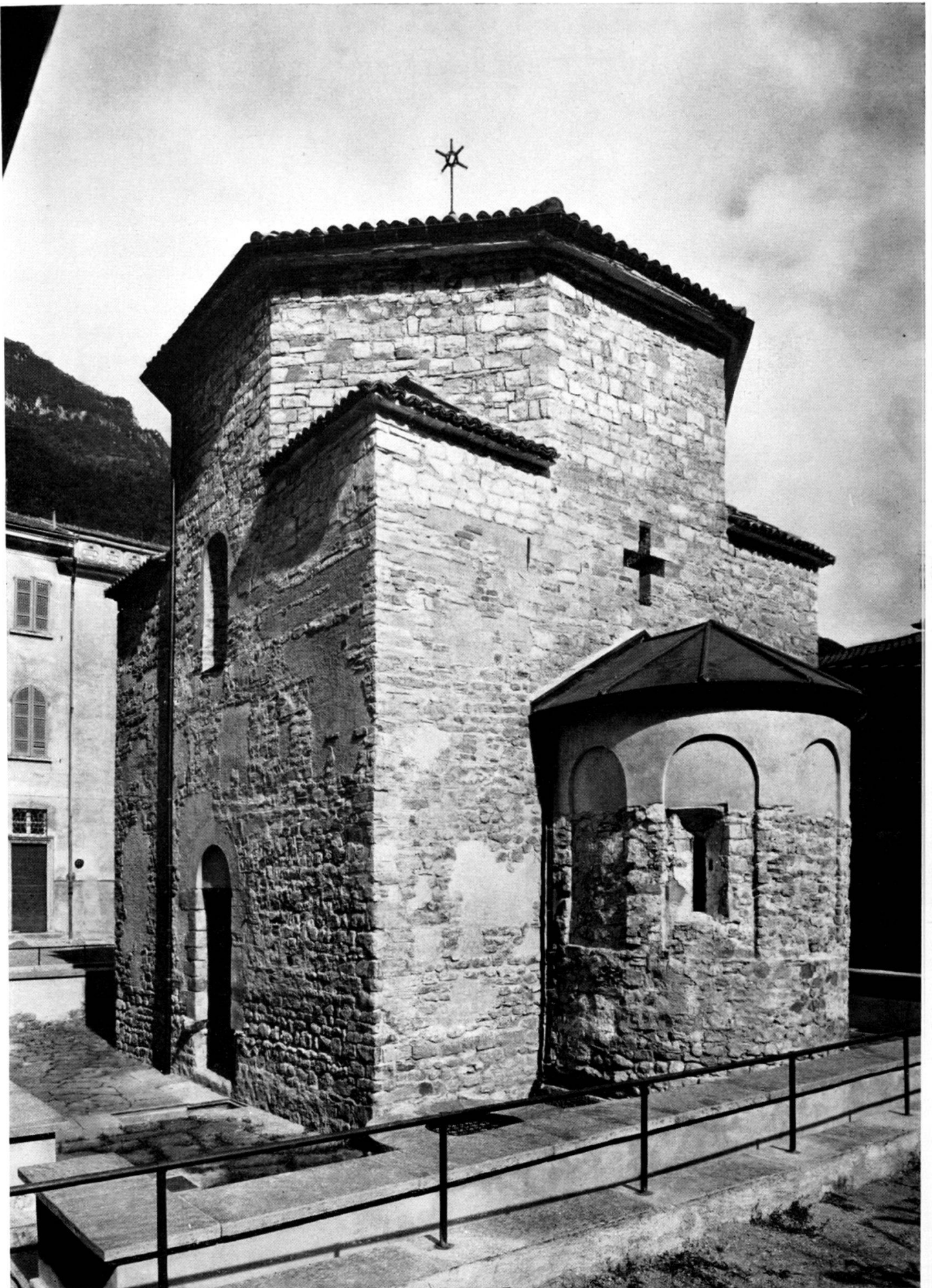
Taf. I. Riva San Vitale Baptisterium, Ost-Süd-Ansicht