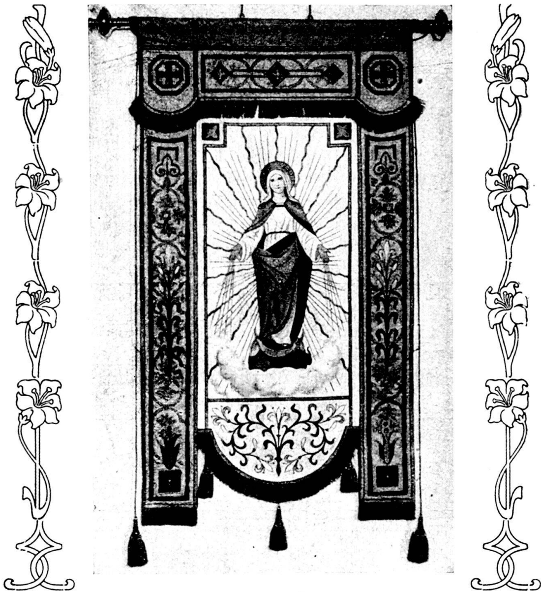
Vorderansicht der neuen Kongregationsfahne.

Sieg unter der siegreichen Fahne Marias würde «sich so recht das Glück und die Gnade, Marienkind zu sein», enthüllen. 26 Im Glöcklein tauchte auch das Bild von der Fahne Marias auf, um die sich die Marienkinder scharten und das die reale Entsprechung in der 1917 neu geweihten Kongregationsfahne mit der Immakulata-Abbildung hatte. 27