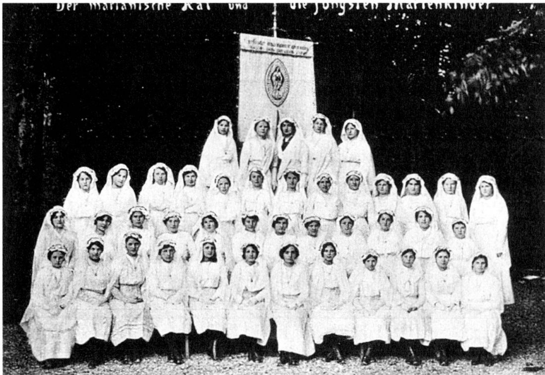
«Der marianische Rat und die jüngsten Marienkinder», Theresianum-Glöcklein , 7,3 (1914), 66.

Es muss auffallen, wenn die offizielle und einzige Institutszeitschrift für ehemalige wie aktive Schülerinnen ihre Inhalte dem Ideal der Marienfigur weihte. Es scheint, als wären die Schülerinnen auch «Marienkinder» und somit identisch mit den Mitgliedern der Marianischen Kongregation des Instituts gewesen, obwohl für die Schülerinnen kein Beitrittszwang zur Marianischen Kongregation bestand. 4