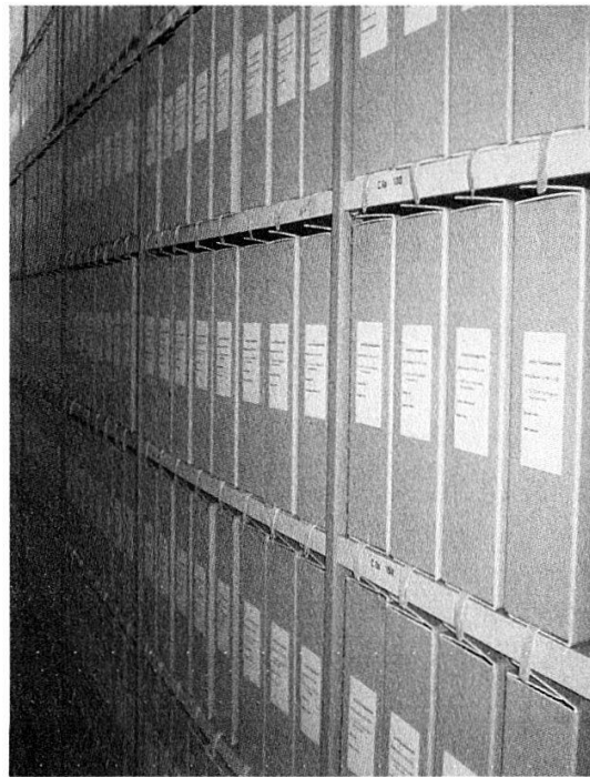
Abbildung 2: Das Archiv des VSJF im modernen Magazin des Archivs für Zeitgeschichte an der ETH in Zürich.