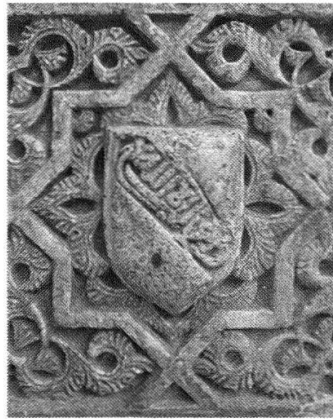
Wappen der Nasriden