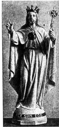
Abbildung 6: Herz-Jesu-Statue, die neben zahlreichen anderen Modellen 1922 unter der Überschrift «Neue Herz-Jesu-Statuen» vom Jahrbuch der feierlichen Familienweihe empfohlen wurden, vgl. Jahrbuch der feierlichen Familienweihe an das heiligste Herz Jesu, 4 (1922), 71.