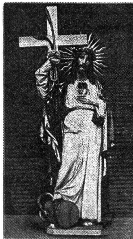
Christus-König-Statue. (Was dem Richter von St. Veit in Weill: Der Herrschend tritt mit dem Fuße auf eine Granate, welche die Schlange umwunden hat.)