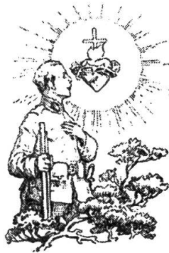
Abbildung 2: Illustration des Sendboten zum Artikel «Ein jugendlicher Held» im Juli 1916, vgl. Der Sendbote des göttlichen Herzens Jesu. Monatsschrift des Gebetsapostolates und der Andacht zum heiligsten Herzen, 52 (Juli 1916), 208.