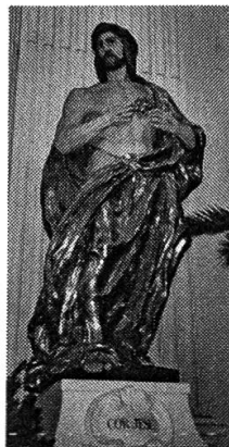
Abbildung 5: Muskulär und monumental: Herz-Jesu-Statue von August Weckbecker aus der St.-Ursenkathedrale in Solothurn, Anfang 1920er Jahre, Höhe 2,70 m, Fotografie Claudia Schlager.