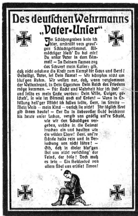
Abbildungen 2/3: Gedichte auf Postkarten, vgl. Anm. 9/10.

Neben diesem gibt es ähnliche Gedichte auf Postkarten: «Des deutschen Kriegers Vaterunser», 6 «Des Feldgrauen Vaterunser», 7 ein Vaterunser von General-