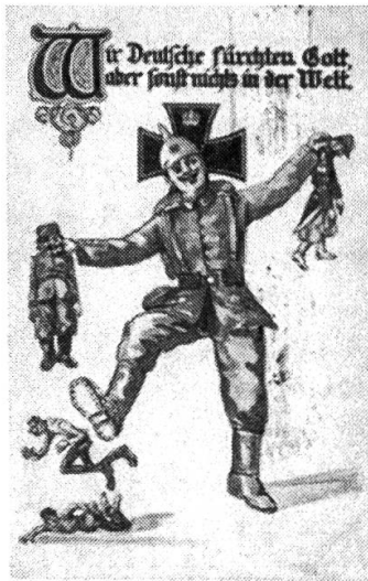
Abbildung 2: Postkarte «Wir Deutschen», PTT Archiv Vers-057 A00012.