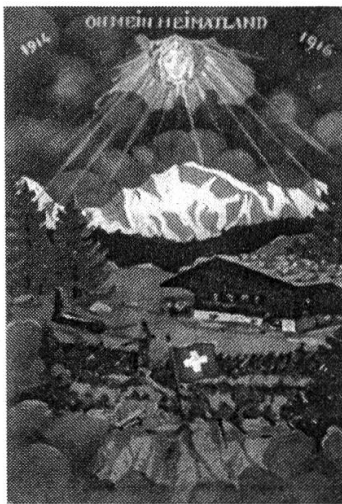
Abbildung 3: Postkarte 0420, aus der Sammlung der Bibliothek am Guisanplatz Bern.

Das Postkartenmotiv «Oh mein Heimatland» 33 , kann als Anspielung auf das Gedicht von Gottfried Keller aus dem Jahre 1846 verstanden werden.