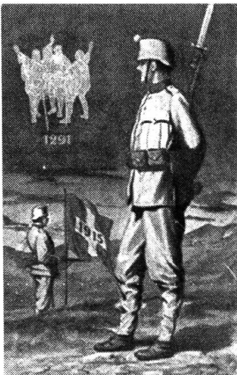
Abbildung 5: Postkarte 0451 aus der Sammlung der Bibliothek am Guisanplatz Bern.

Zwei Schweizer Soldaten bewachen einen Posten. Der hintere Soldat steht einsatzbereit vor der Schweizer Fahne, in der die Jahreszahl 1915 angegeben ist. Im Hintergrund lodern einzelne Brandherde. Über dem einsatzbereiten Soldat befindet sich die Zahl 1291. Über diesem sind drei Männer abgebildet, die jeweils den rechten Arm in die Höhe strecken. Um sie herum befindet sich eine Art Stern.