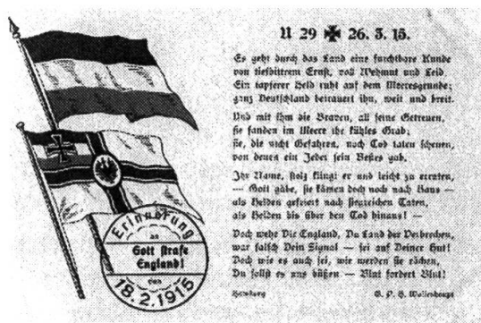
Abbildung 1: Postkarte «Gott strafe England», Vers-057 A00012.

Die Überzeugung im Namen Gottes zu handeln, zeigt sich an einigen Bildmotiven der beschlagnahmten Postkarten aus dem PTT Archiv. So bezieht sich die Postkarte «Gott strafe England» auf den anhaltenden U-Boot Krieg und die Versenkung der U 29 durch das Schlachtschiff «HMS Dreadnought» 19 der Royal Navy. Geprägt wurde diese Form des Grusses von dem deutschen Schriftsteller Ernst Lissauer, der unter anderem einen Hassgesang verfasste. Lissauers Lied liess sich ebenso in den beschlagnahmten Karten finden. 20