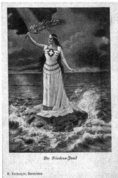
Abbildung 6: Postkarte 0621 aus der Sammlung der Bibliothek am Guisanplatz Bern

Während die angrenzenden Staaten in Blut ertranken, konnte die Schweiz wie durch ein Wunder die Neutralität des Landes sichern. Dabei wurde teilweise die Neutralität als Mission empfunden, was das Bild der «Friedensinsel Schweiz» 56 hervorbrachte. Wenn von der «Friedensinsel Schweiz» gesprochen wird, so er- scheint dieser Ausdruck meist in Verbindung mit der Gestalt der Helvetia. Die nächste Postkarte zeigt den Zusammenhang zwischen der politischen und religi- ösen Symbiose, durch den Einsatz eines religiösen Symbols, wie dem Palm- zweig. Aufgrund des rechten Palmzweiges in ihrer Hand, lässt sich eine Verbin- dung zum religiösen Mythos herstellen.