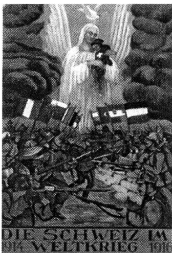
Abbildung 4: Postkarte 0634, aus der Sammlung der Bibliothek am Guisanbibliothek Bern.

Auf der beschriebenen Postkarte «Oh mein Heimatland» kann das Gesicht der Helvetia erahnt werden, die als nationale Patronin über die Schweiz wacht. Es befinden sich weitere Druckpostkarten im Archiv der Militärbibliothek zum Thema Helvetia, die ikonographisch interpretiert werden können. Meist wird Helvetia dabei als Schutzpatronin inszeniert.