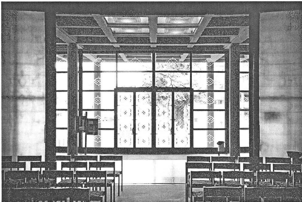
Abbildung 2: Blick nach draussen, bei geöffneten Schiebetüren