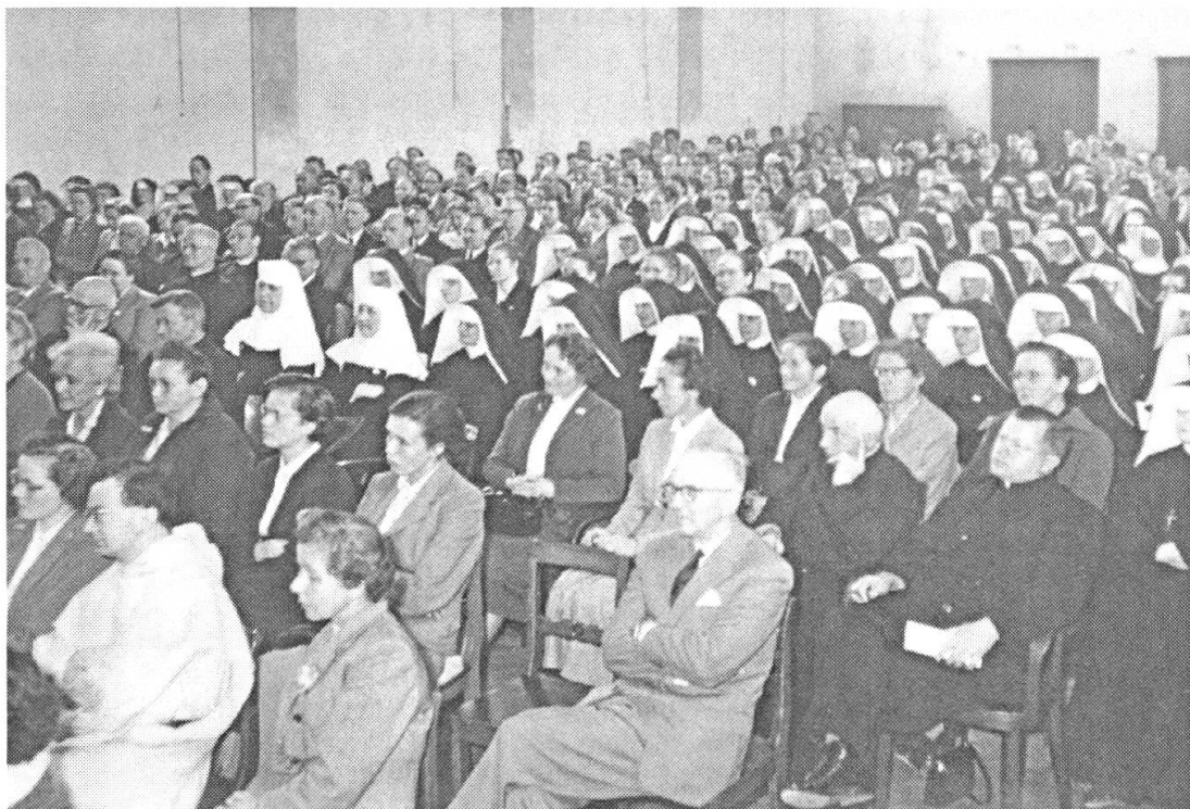
Abbildung 4: Der Blick in den Saal an der Generalversammlung von 1956 offenbart, dass Geistliche beiden Geschlechts einen grossen Anteil der KLVS-Mitglieder ausmachten.