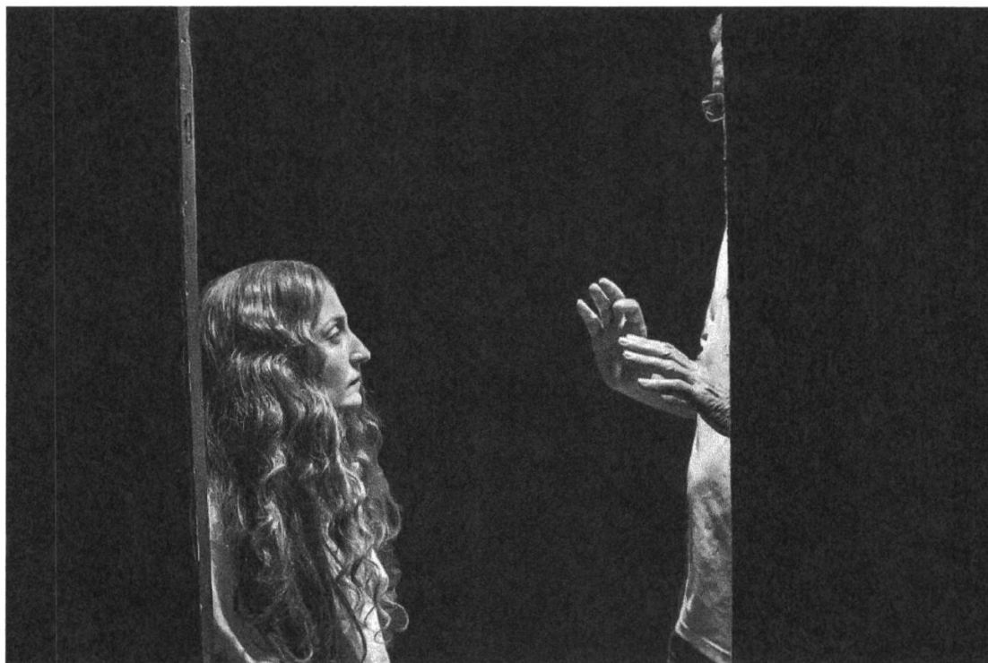
Immagine 3: Alba Rohrwacher (Maria Perletti) diretta dal regista.