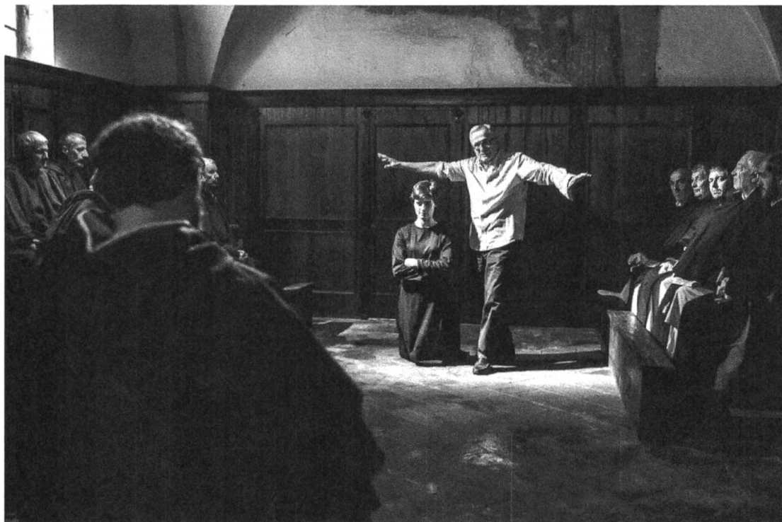
Immagine 1: Marco Bellocchio sul set di Sangue del mio sangue.