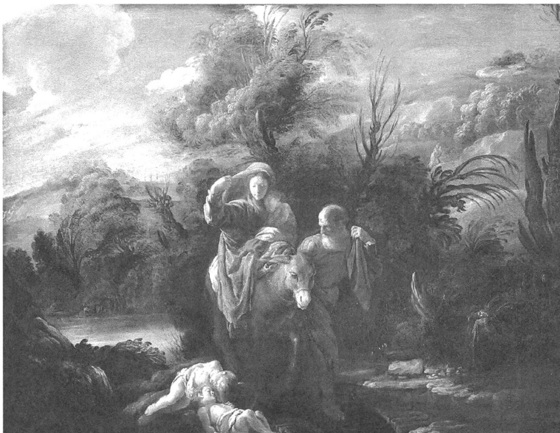
Abbildung 1: Domenico Fetti (1589–1624), Flucht nach Ägypten, um 1622/23, Öl auf Pappelholz, 63x80,5 cm, Kunsthistorisches Museum Wien, Gemäldegalerie.

einem Bild des Barockmalers Domenico Fetti aus dem Jahr 1622/23 beispielsweise liegen am Wegesrand der flüchtenden Heiligen Familie zwei bleiche Leichname getöteter Kinder ( Abb. 1 ). 15 Sie symbolisieren die tödliche Gewalt, der das Jesuskind und die Heilige Familie nur durch Flucht entgangen sind und die diese begründet und rechtfertigt. Das Bild visualisiert die beiden Optionen von Tod und Leben, zwischen denen die Flucht liegt. 16