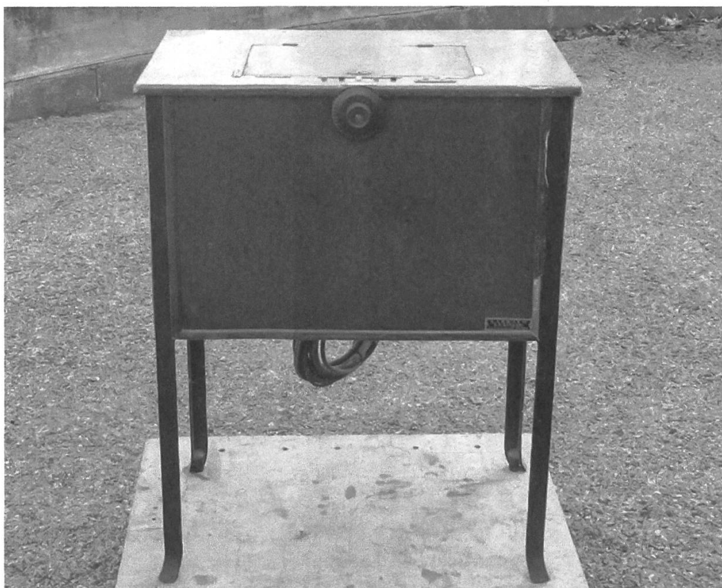
Figura 2: Auto-organo Barbieri che fu installato nella chiesa di San Biagio di Magliaso, Canton Ticino, alla fine del 1932.

Oltre al rullo di Figura 1, è giunto fino a noi l'apparecchio della chiesa di San Biagio di Magliaso (Figura 2), il terzo in ordine cronologico di quelli installati nel Canton Ticino. Leggiamo infatti in un articolo del 10 gennaio 1933 che «anche la nostra parrocchia possiede l'autoorgano», che sull'organo nuovo, a due manuali «dà – in tutta la sua estensione – effetti mirabili di pianissimo, di forte, ecc. Le nostre sacre funzioni riescono così sempre belle. [...] l'autoorgano qui fa da maestro e il suo servizio è davvero encomiabile. Qui sono tutti soddisfatti e la brutta e malevole critica, fin qui non è giunta». 44 Questa era la prima versione dell'apparecchio Barbieri, una «Cassetina» uguale a quella vista da Schuster nell'audizione di Musocco il 7 agosto 1931.