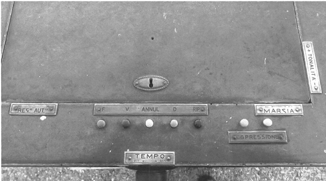
Figura 3: Auto-organo di Magliaso, dettaglio della parte superiore con il coperchio del lettore di rulli chiuso. (Per gentile concessione della Fondazione Franco Severi, Cesena).

Barbieri dotò il suo apparecchio di accorgimenti che ne rendessero l'uso molto flessibile durante le funzioni liturgiche: sulla parte superiore (v. Figura 3) sono presenti vari comandi (registrazione automatica, annullatore, tempo, espressione, marcia, tonalità), grazie ai quali l'utilizzatore, organista o amatore, poteva, ad esempio, annullare la registrazione originale del rullo e fornirgliene una propria. L'operatore poteva inoltre intervenire su registri, velocità e tonalità, per adattare le musiche sacre al canto dei fedeli, secondo i propri orecchio, gusto e sensibilità. Questi comandi dimostrano che il detrattore Virgilio Molfino non conosceva il funzionamento dell'apparecchio, quando scriveva che il «coro canterà in un tono, e l'auto-organo risponderà in un altro»: in realtà era possibile adattare ad orecchio il tono dell'organo a canne a quello del coro, esattamente come era solito fare l'organista umano.