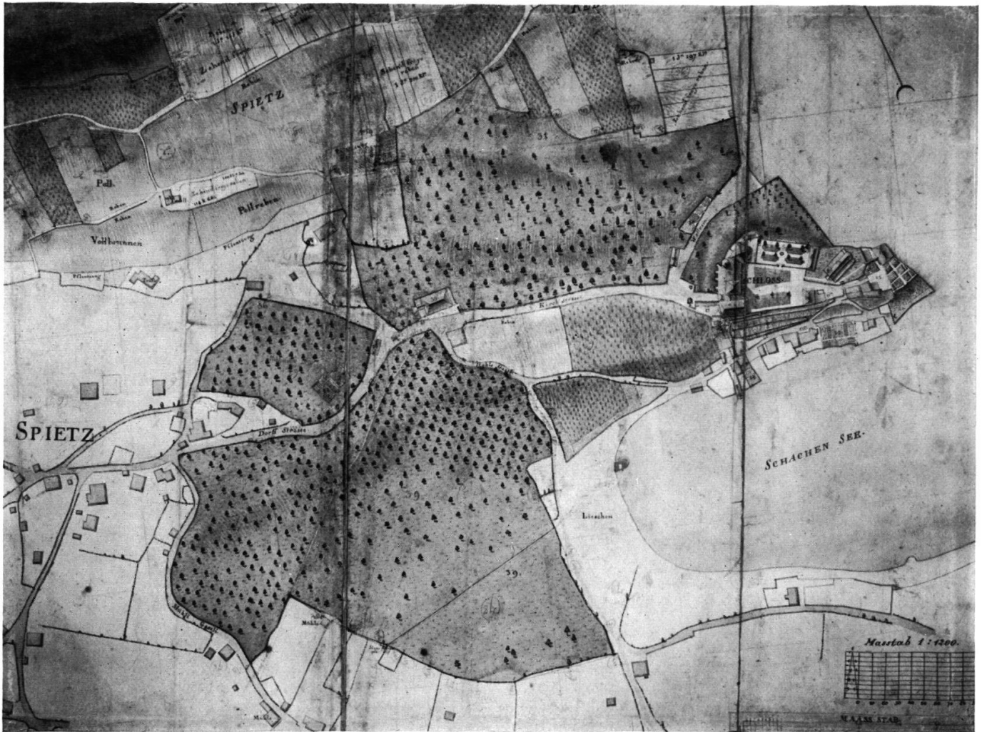
Plan von Spiez 1793/95.