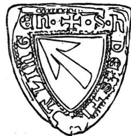
Wappensiegel des Freiherrn Heinrich von Strättligen, Herrn von Spiez, aus dem Jahre 1335.