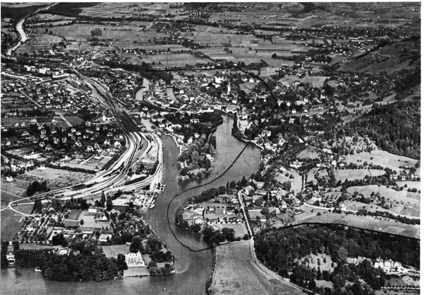
Fliegerbild von Thun. Grenze des Freigerichts „zur Lauenen“.