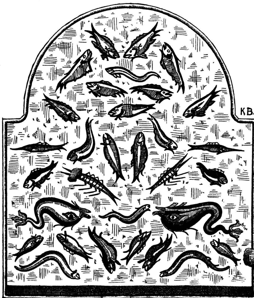
Römisches Badebecken mit Fischmosaik. (Norden →)

Notiz, «um Münsingen ist ein altes Wesen und es ist dort eine größere Stadt gestanden, als die hiesige (Bern). Sie sind zu gleicher Zeit, wie Wiflisburg und andere, zerstört worden», gewinnt dadurch seltsam an Bedeutung 3 . Unsere alten Chronisten haben aus der Ortsüberlieferung manchen wertvollen Hinweis geschöpft und gerettet. Ähnliche Badeanlagen haben sich 1930 in Üten- dorf (Amt Seftigen) und Vicques (Amt Delsberg) 1935—1937 gefunden. Alle diese Bäder gehörten zu schloßartigen Gutshöfen, deren Einkünfte meist auf Ackerbau und Viehzucht beruhten, im letztern Falle vielleicht auf Eisen- ausbeutung.