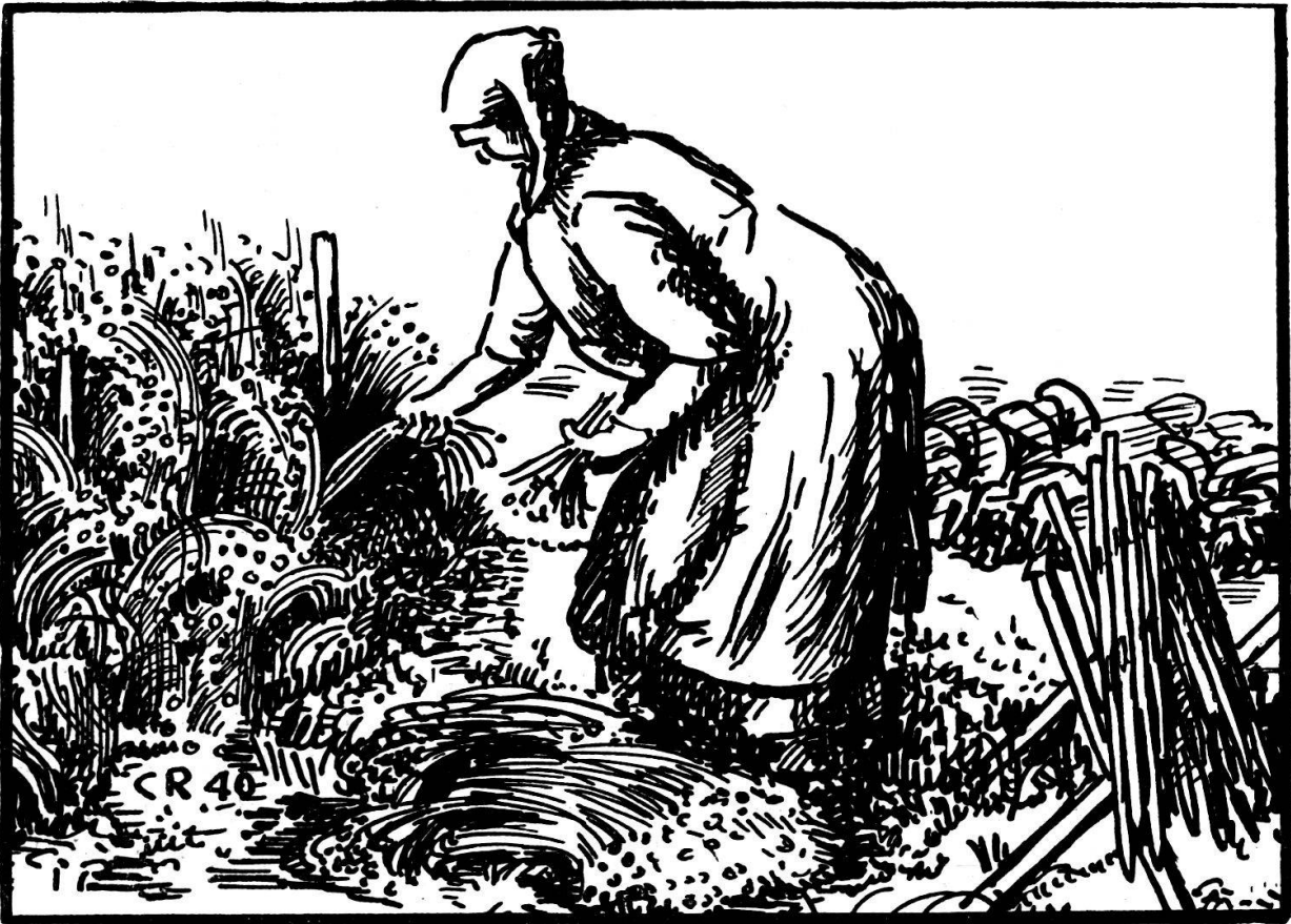
Abb. 20. Rosetti beim Flachsziehen (August 1940).

Jetze nimmt me der Chübu i ei Hang, louft zmits dür die erschi Sattelle u laat ei Hampfele Saame nach der angere dür d'Finger loufe. Het mes i ei Wääg gsäit, so faat me uf der angere Syte aa u säit o i de churze Sattelle. Der Flachs mueß me früech säie, hüür hei mer ne däich scho im Merze gsäit.