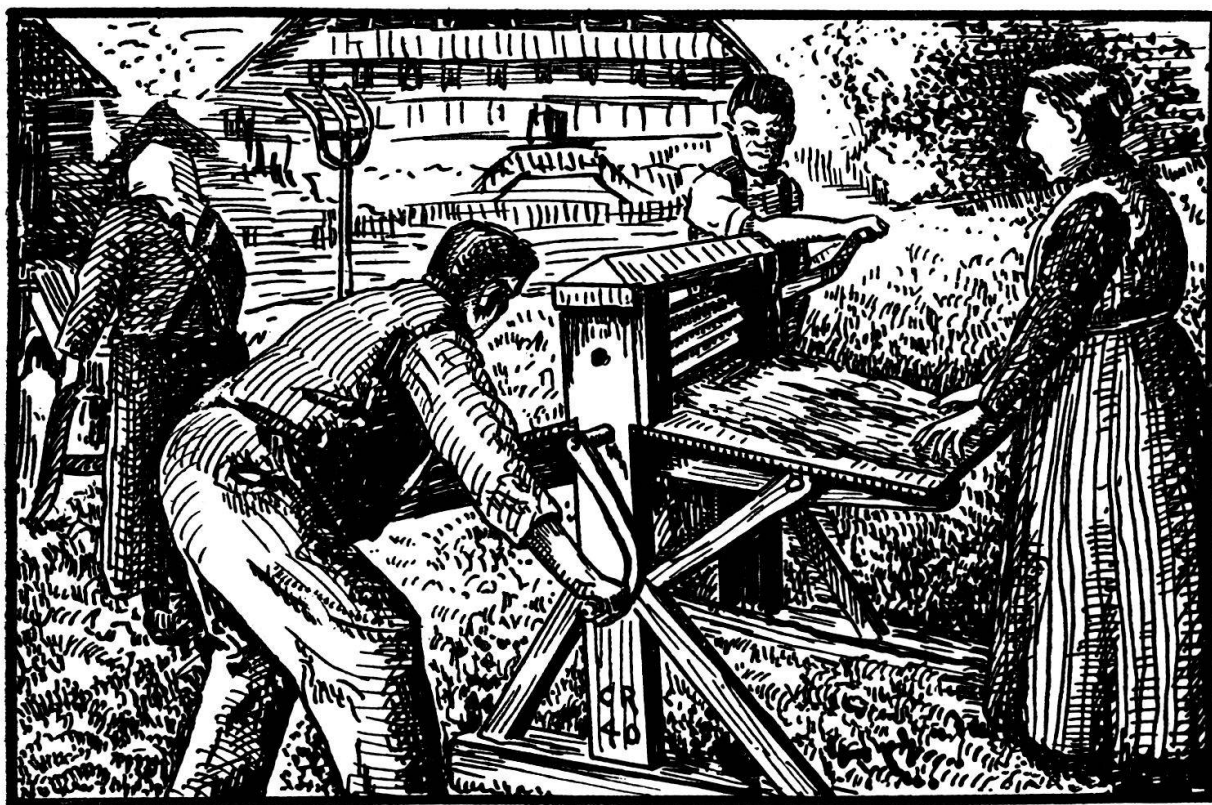
Abb. 21. Die beiden «Drückine» an der Brechmaschine.

De wird gfädnet. Was für Fade, as me da bruuch? Alle isch guet, wener nume hett. Der vorder Winter hei mer Chudergarn gspunne, mängisch het me alt Strümpf ufglaa. Die Fäde zieht me chrüzwys vo eim Stäckli as angere.