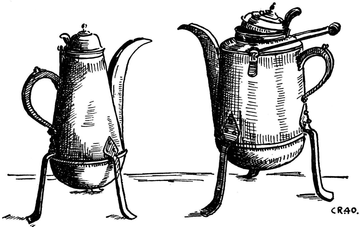
Abb. 22. Zwei dickbäuchige Kaffeekannen aus dem vorigen Jahrhundert. Diejenige rechts verwendete man hauptsächlich auf dem Felde draußen.

aus überbrochen ischt, mueß me no einischt aus uf d'Hütte tue u wärme. Da mueß de der Deerer ufpasser, u au Schyßbott chehre un es chlys Fүүr haa, süsch chönnt de die Sach i Rouch ufgaa. We ds Fүүr wott z'höoch wäärde, schlaat me mit em Gohn Wasser yche. E tummi Sach isch o gäng mit dem churze Zүүg, wo us de Buurdine useghüderet u de a der Böschig vo der Fүүrgruebe blybt lige. Ufs Maal brönnts u flüg uf. Drum wüsch me das Zүүg aubeneinisch mit dem nasse Bäse ache. Sött so ne Gatter verbrönne, das gieng de i ds Gäud, wil mängisch e Viertu oder e Fүүtu druffen isch. Ds Überbräche rütscht de albe. Die Räschte Tingu sy grad druus. Jetze wird e Hamp-