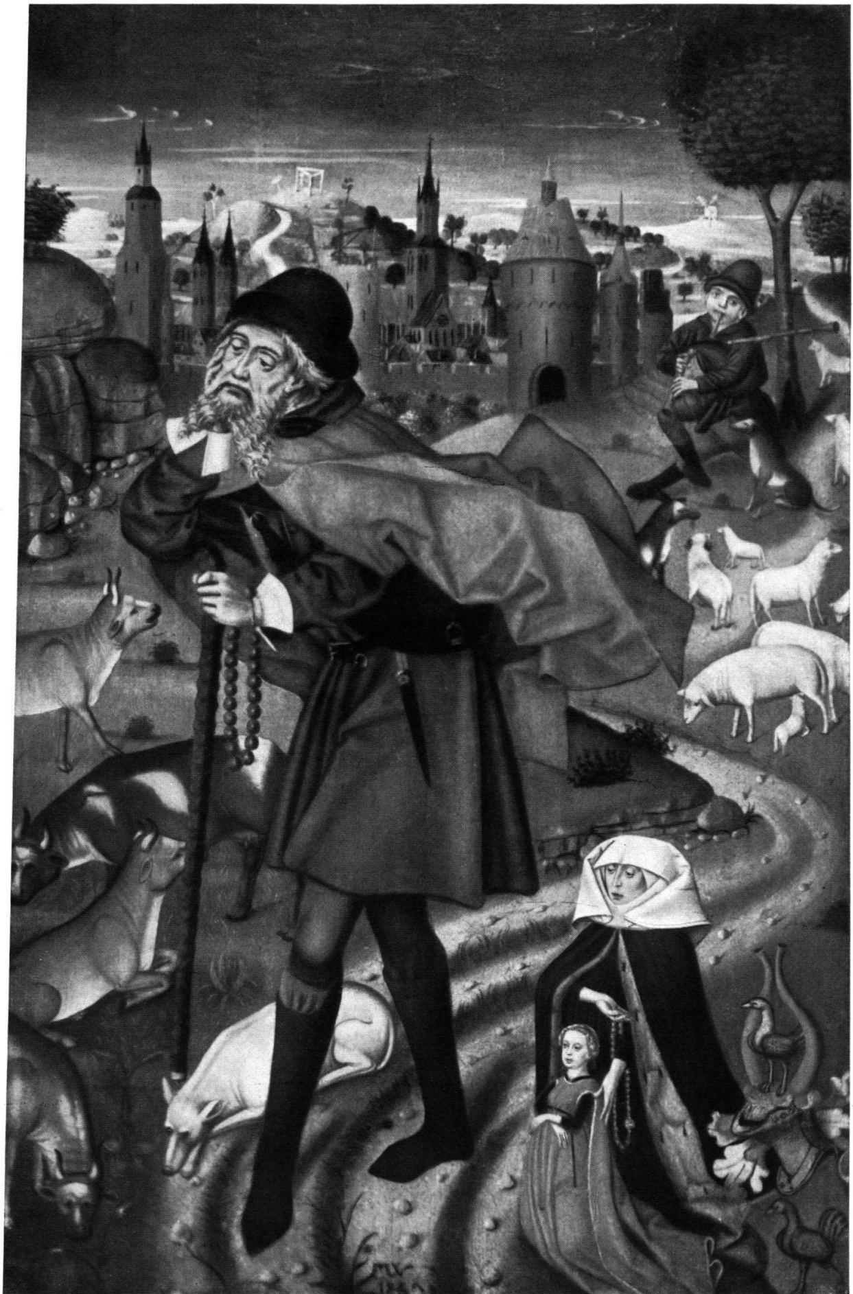
Friedrich Walther. Hl. Wendelin, 1467. Bern, Historisches Museum.