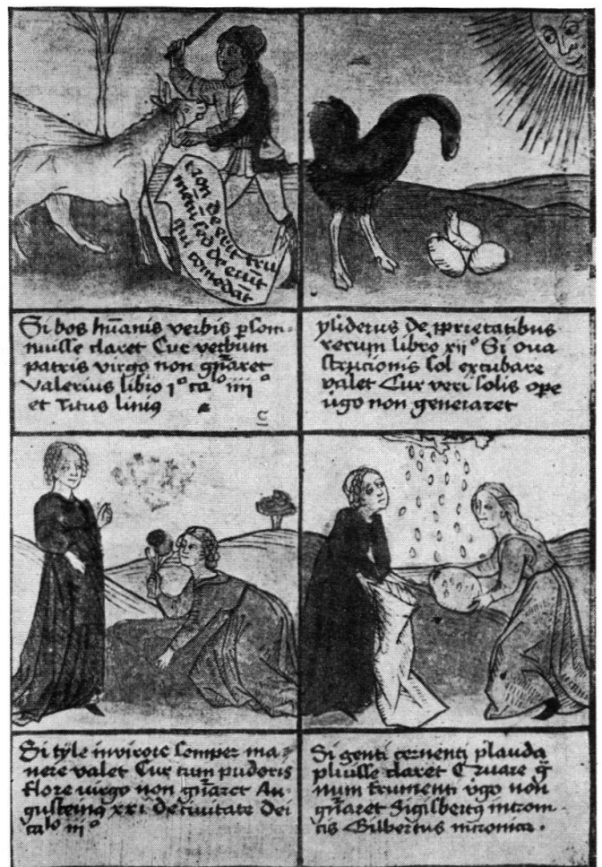
3. Friedrich Walther. Aus dem Defensorium virginittatis Mariae. 1470.