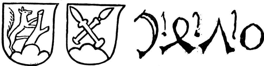
Friedrich Walther und Hans Hurning. Biblia pauperum . Druckvermerk.

Friderich Walt- hern mauler / zu Nördlingen und Hans / Hurning habent diß büch / mitt einander ge- macht