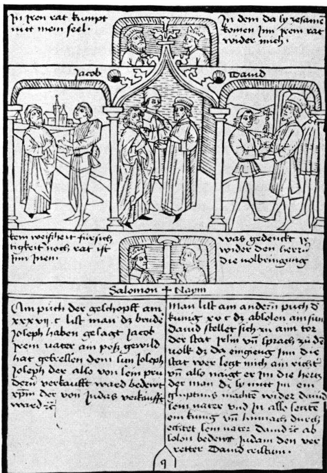
2. Friedrich Walther und Hans Hurning. Aus der Biblia pauperum. 1470.