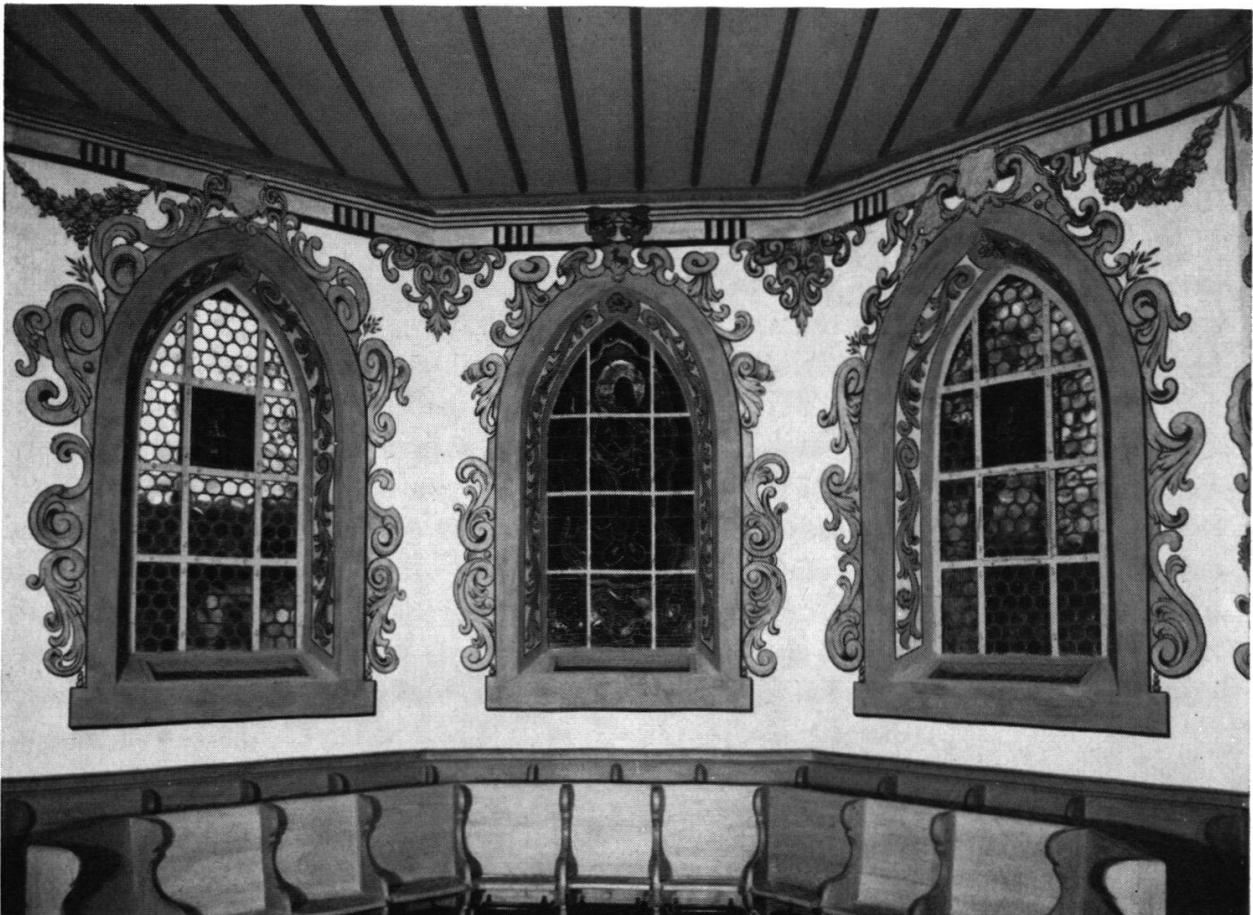
Kirche Wynigen: Chor mit Barockmalerei um 1670 nach Restaurierung durch H. A. Fischer, Bern (Photos H. A. Fischer)