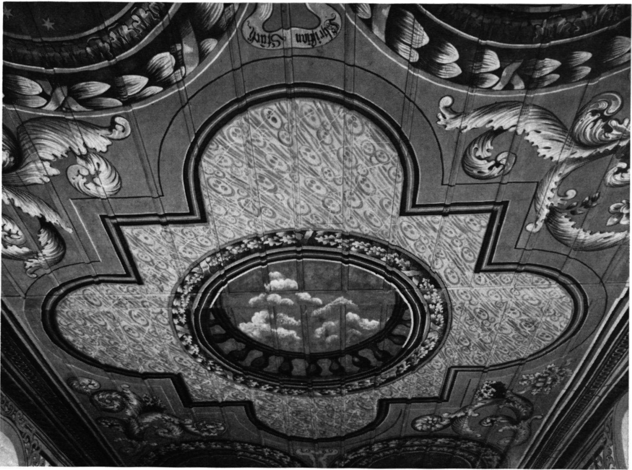
Kirche Trachselwald: Barockdecke, gemalt 1680 von Christian Stuckj mit illusionistischen Durchblicken in den Himmel. Zustand nach Restaurierung durch H. A. Fischer, Bern