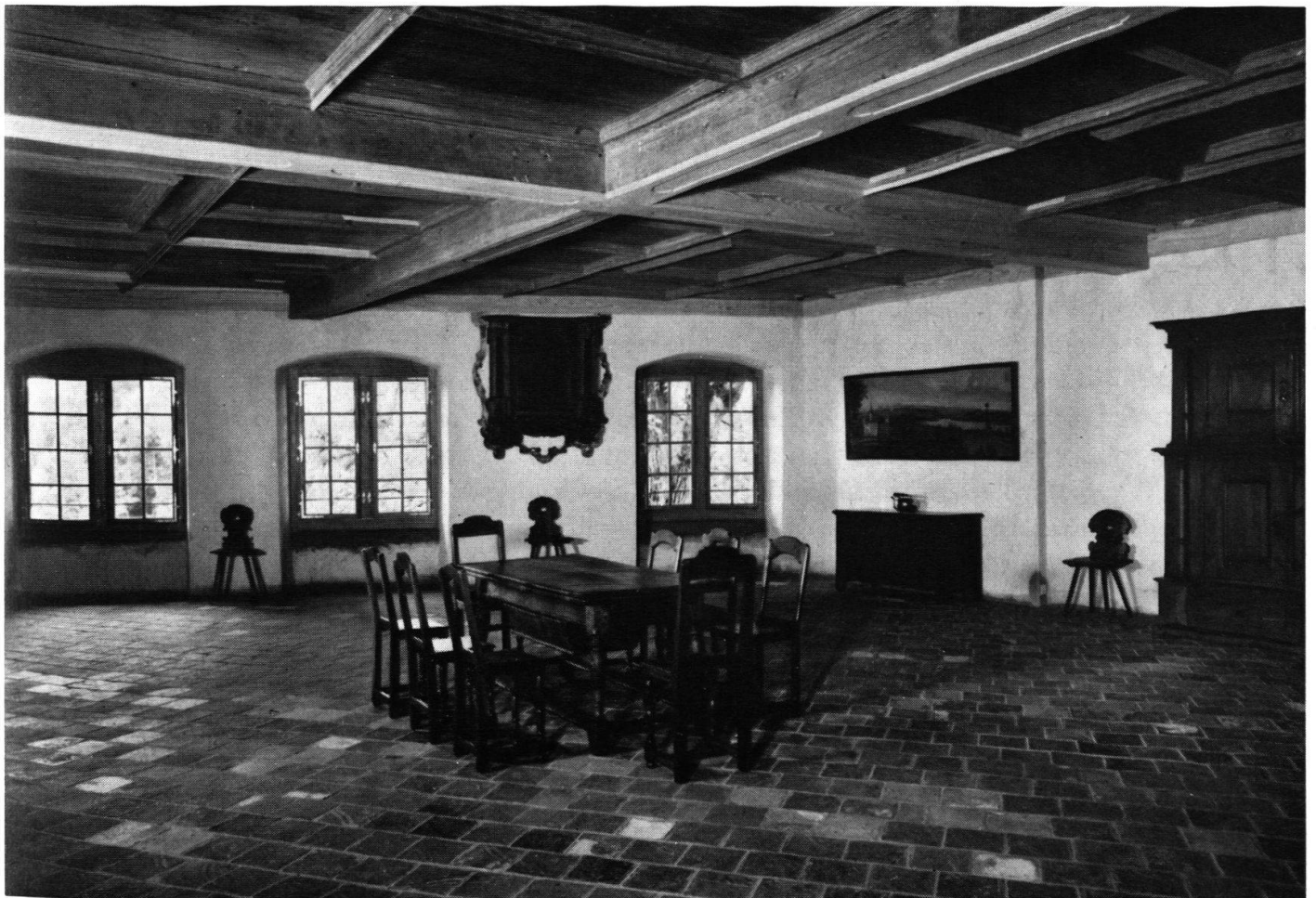
Der Saal nach der Wiederherstellung im August 1958.