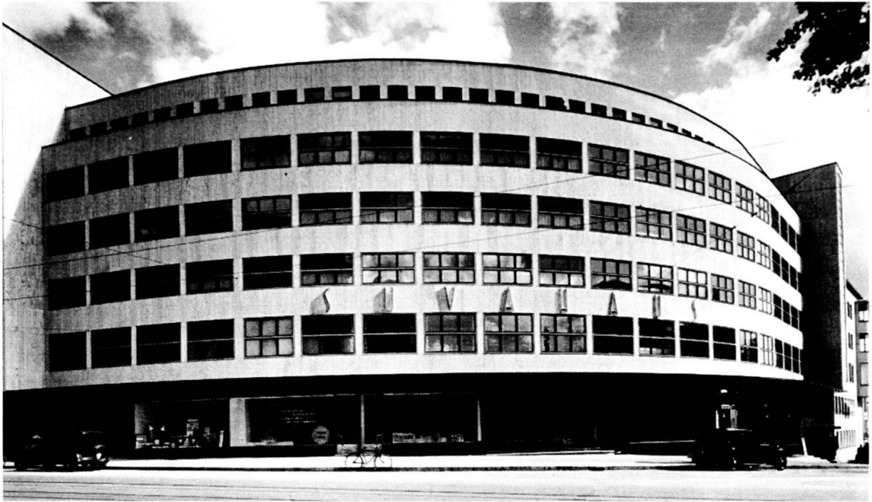
O. R. Salvisberg, SUVA-Haus, Bern, 1930-31, ursprünglicher Zustand.