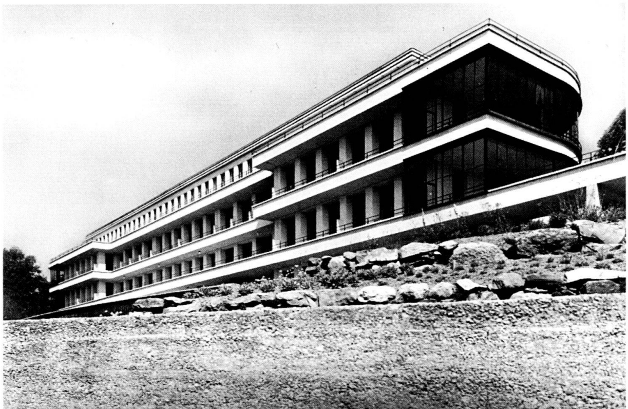
O. R. Salvisberg, Lory-Spital Bern, 1924-29, ursprünglicher Zustand.