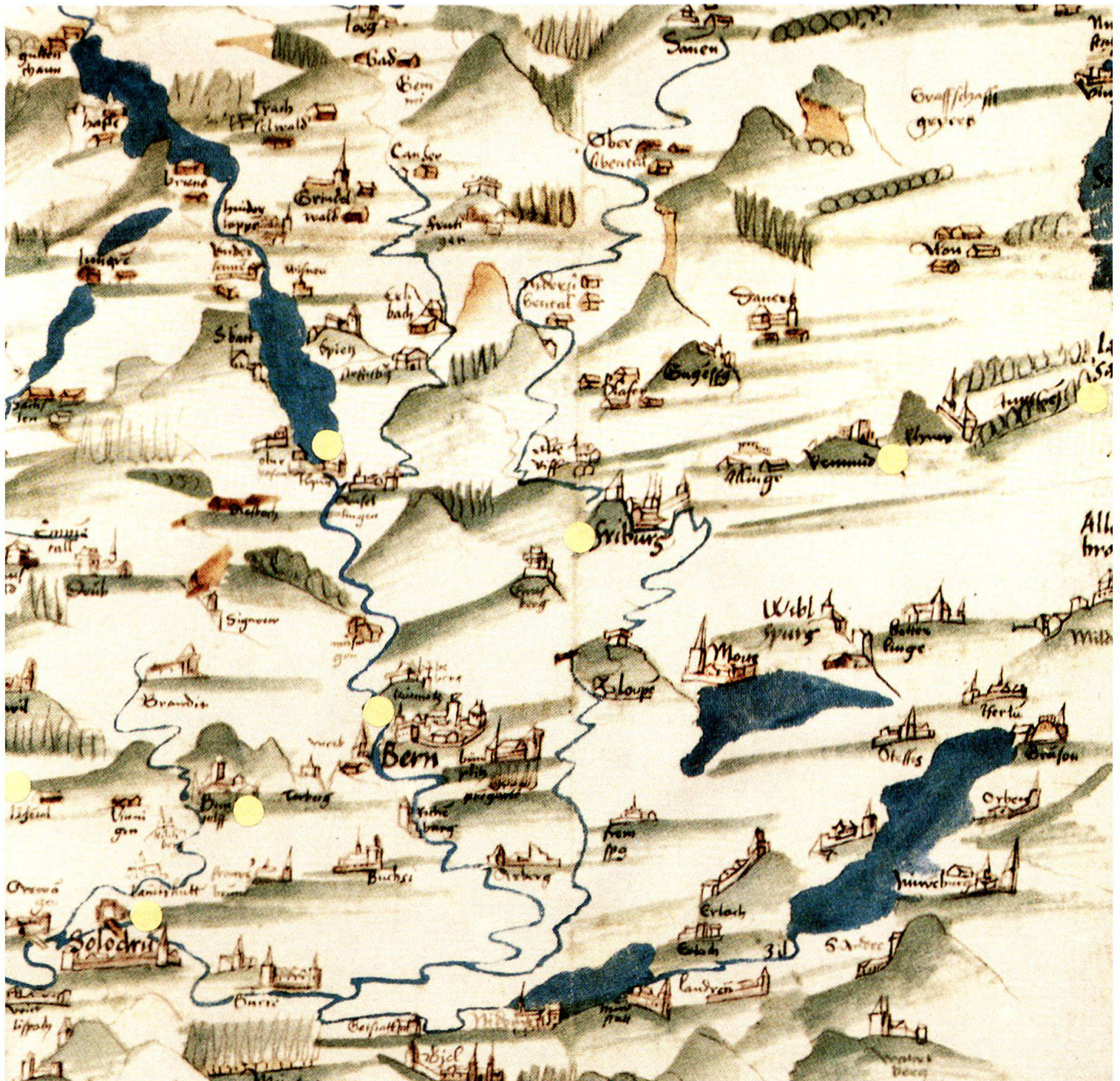
Die Tage der Entscheidung, erlebt von einem deutschen Reisenden. Hans von Waltheims Route April/Mai 1474 mit Angabe der Wirtshäuser (gelb markierte Orte): «Roter Löwe» in Langenthal, «Krone» in Burgdorf, «Glocke» in Bern, «Blauer Turm» in Freiburg, «Weisses Kreuz» in Romont, «Weisse Lilie» in Lausanne; Rückweg: «Freienhof» in Thun, «Krone» in Solothurn. Zeitgenössische Karte des Konrad Türst, um 1495, Ausschnitt (nach: G. Grosjean, «500 Jahre Schweizer Landkarten». Orell Füssli, Zürich, 1971).