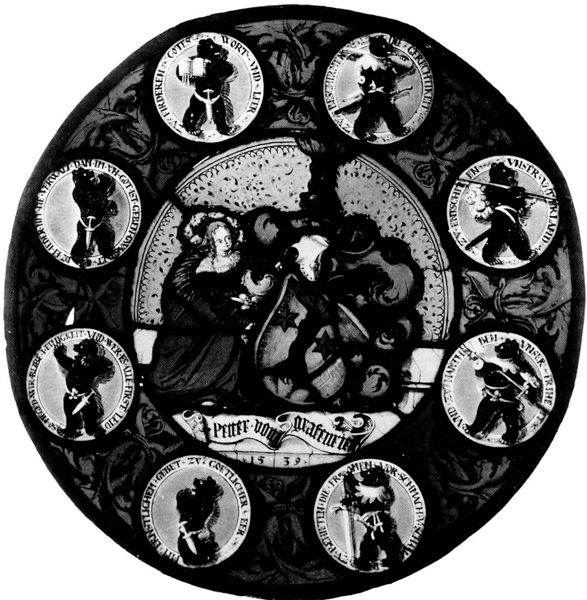
Auf der Rundscheibe von 1539 führen um das Wappen des Peter von Graffenried (1507–1562) acht Bären die geistlichen und weltlichen Aufgaben der Obrigkeit vor Augen. Vier Bären proklamieren die geistlichen Prinzipien: Zv firderen Gotes Wort vnd Leer – dz ein ieder nit me verwalt, dan im von Got ist geben Gwallt – so megend wir bliben in einigkeit, vnd wer es allen Firsten leid – mit ernstlichem Gebet zv goetlicher Eer. Auf der rechten Seite werden die weltlichen Aufgaben der Obrigkeit vorgestellt: «Zv beschirmen die Gerechtigkeit – zv entschiten vnser Vaterland – vnd zu hanthaben vnser Friheit – zv behieten die Fromen vor Schmach vnd Schand.» (Bernisches Historisches Museum, Depostium, Inv. Nr. 20210)