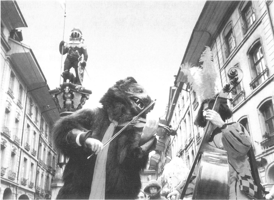
Abb. 11 Der Geige spielende Bär an der Berner Gassenfastnacht 1992. Neben der Kinderfastnacht und dem grossen Umzug der «Guggenmusiken» spielen einzelne Maskierte zum Tanz auf oder führen kleine Theaterstücke vor.

Humor. Humor sei «eine der wichtigsten christlichen Tugenden. Der humorvolle Mensch nimmt sich selber nicht so fürchterlich ernst» und hat Verständnis für die Schwächen des andern. Deshalb: «Wenn wir hier in Bern diesen echten fastnächtlichen Geist pflegen, dann ist gar nicht zu bedauern, dass es keinen eigentlichen Berner Karneval gibt.» 132