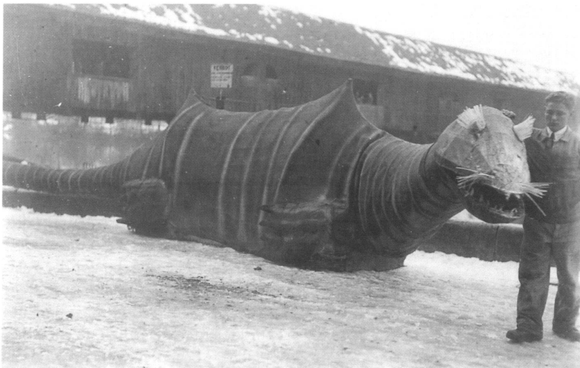
Abb. 12 Am Fastnachtsumzug in Büren an der Aare war 1935 das 14 Meter lange Ungeheuer vom Loch Ness zu bestaunen. Es schnaubte Mehlwolken aus seinem Rachen und verfolgte das Schiff «Bürania», dessen Matrosen heldenhaft mit dem Tier kämpften.