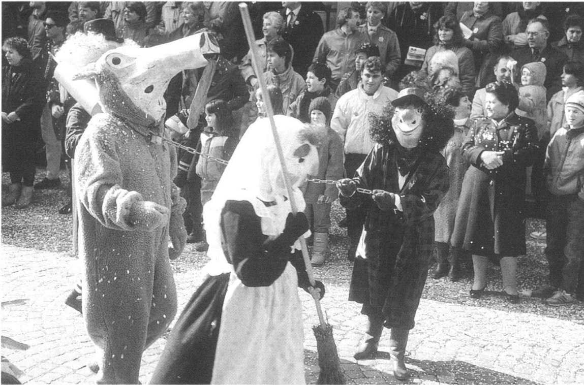
Abb. 13 Bär, Bärenführer und Besenbethli an der Langenthaler Fastnacht um 1990. Zusammen mit dem «Eselidoktor», den Gümpern und einem Tambour bilden sie eine Besonderheit, eine Bärenbande. Der Ursprung dieser immer gleich zusammengesetzten Maskengruppe liegt im Dunkeln. Sie widmet sich mit Hingabe dem «Tschämele», dem Betteln um Gaben.

tag sind die Kinder mit ihrem Umzug an der Reihe, «anschliessend Kindermaskenbälle» und um 20 Uhr der «Kehrausball» der Erwachsenen. Endlich, am Dienstag Abend, trennt man sich von der Fastnacht mit der «Uslumpete» in verschiedenen Lokalen. Eine Reihe von Fastnachtszeitungen würzen die närrischen Tage, die älteste erschien bereits 1887 mit dem Titel «Narrenbeilage zum Amtsanzeiger». 152