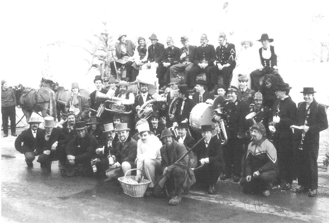
Abb. 7 Tannenfuhr in Hilterfingen 1986. Alle vier Jahre führen junge Bürgerinnen und Bürger eine geschenkte und geschmückte Tanne durchs Dorf. Traditionelle Maskengestalten und Musikanten begleiten den Umzug. Am Schluss wird der Stamm versteigert, mit dem Erlös bezahlen die jungen Leute ein Festessen.

Erlös decken die ledigen Mädchen und Burschen im Jungbürgeralter die Unkosten der Fuhr und die Kosten für ein gutes Nachtessen. 101