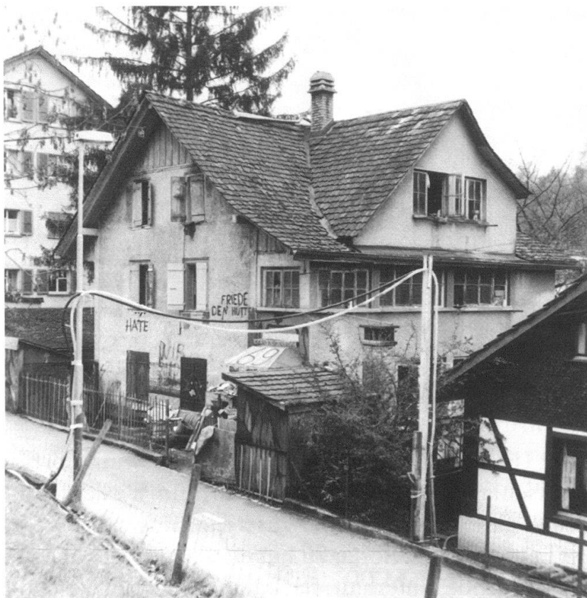
Jurastrasse 69: Situation vor dem Abbruch.

Das einfache, giebelständig zur Strasse stehende, zweigeschossige Wohn- und Gewerbehaus JURASTRASSE 69 mit ausgebautem Dachgeschoss und «Cabinet für Gewerbe» im hangseitig freiliegenden Untergeschoss wurde 1864 durch den Zimmermeister Frédéric Winkelmann erbaut. Die Fassaden wurden nachträglich mit Holzschindeln verkleidet und 1927 erfuhr der nordseitige Erschliessungstrakt bauliche Veränderungen. Die Liegenschaft war ein wichtiger Bestandteil der Gebäudegruppe der hinteren Jurastrasse, einer zusammenhängenden Gruppe von ähnlichen, abwechselnd links und rechts die Jurastrasse säumenden, zur Erstbebauung der Lorraine gehörenden Häusern von ländlich-spätklassizistischem Habitus. Die Gebäudegruppe zeigt exemplarisch die Wohnverhältnisse einfacher Leute im letzten Drittel des 19. Jahrhunderts.