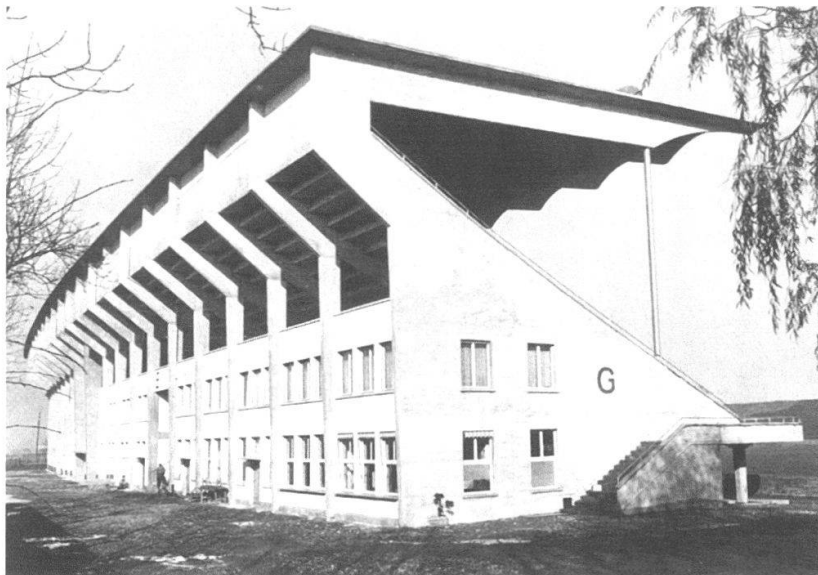
Stadion Wankdorf: Historische, nicht datierte Aufnahme der Tribüne.

über Ungarn 1954 machte den Namen Wankdorf in Deutschland zu einem Symbol für ein wiedergefundenes nationales Selbstbewusstsein, das seine Kraft bis heute nicht verloren zu haben scheint. Der absolut ungenügende Unterhalt der Bauten, welcher wohl auf die sich schon in den 1960er-Jahren abzeichnenden Neubauwünsche zurückzuführen war, führte zu der von der Presse bereitwillig verbreiteten, aber falschen Meinung, dass die Gebäude mit verhältnismässigem Aufwand nicht mehr zu halten gewesen seien. Angesichts des hohen öffentlichen Drucks widersetzte sich die Denkmalpflege dem Abbruch nicht – dies unter dem klaren Vorbehalt, das neue Gebäude sei in hoher architektonischer Qualität zu errichten. Mitte 1998 wurde ein Wettbewerb ausgeschrieben und im Mai 2001 schliesslich die Baubewilligung für das mehrfach überarbeitete Siegerprojekt erteilt. Das alte Stadion Wankdorf wurde im August 2001 abgebrochen.