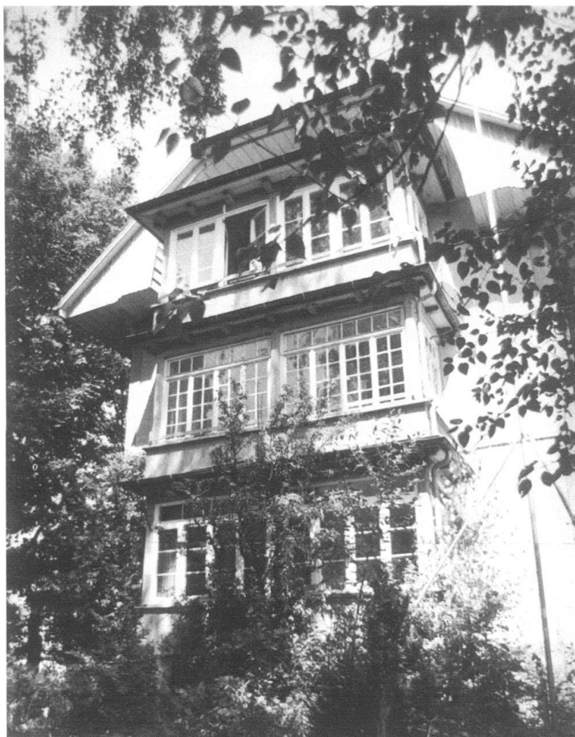
Stöckackerstrasse 98: Westfassade vor dem Abbruch 2004.

des Hauses im damals noch von ländlichen Bauten dominierten Stöckackerquartier erklärbar. In seiner Gesamterscheinung blieb das Gebäude während über 90 Jahren ohne bedeutende Veränderungen erhalten. Umbauten im Jahr 1955 für die sanitären Einrichtungen veränderten lediglich die Nordwestfassade. Mit dem 1960 erlassenen «Bebauungsplan Schwabgut» war der Abbruch des Baus seit geraumer Zeit sanktioniert. Dieses frühe «Todesurteil» konnte auch die Einstufung des architekturgeschichtlich wertvollen Objekts als «erhaltenswert» im Bauinventar Bümpliz nicht rückgängig machen. Nach langer Planungszeit wurde im Jahr 2003 ein den Planungsgrundlagen entsprechendes Bauprojekt genehmigt und das Gebäude im Februar 2004 abgebrochen. R.F.