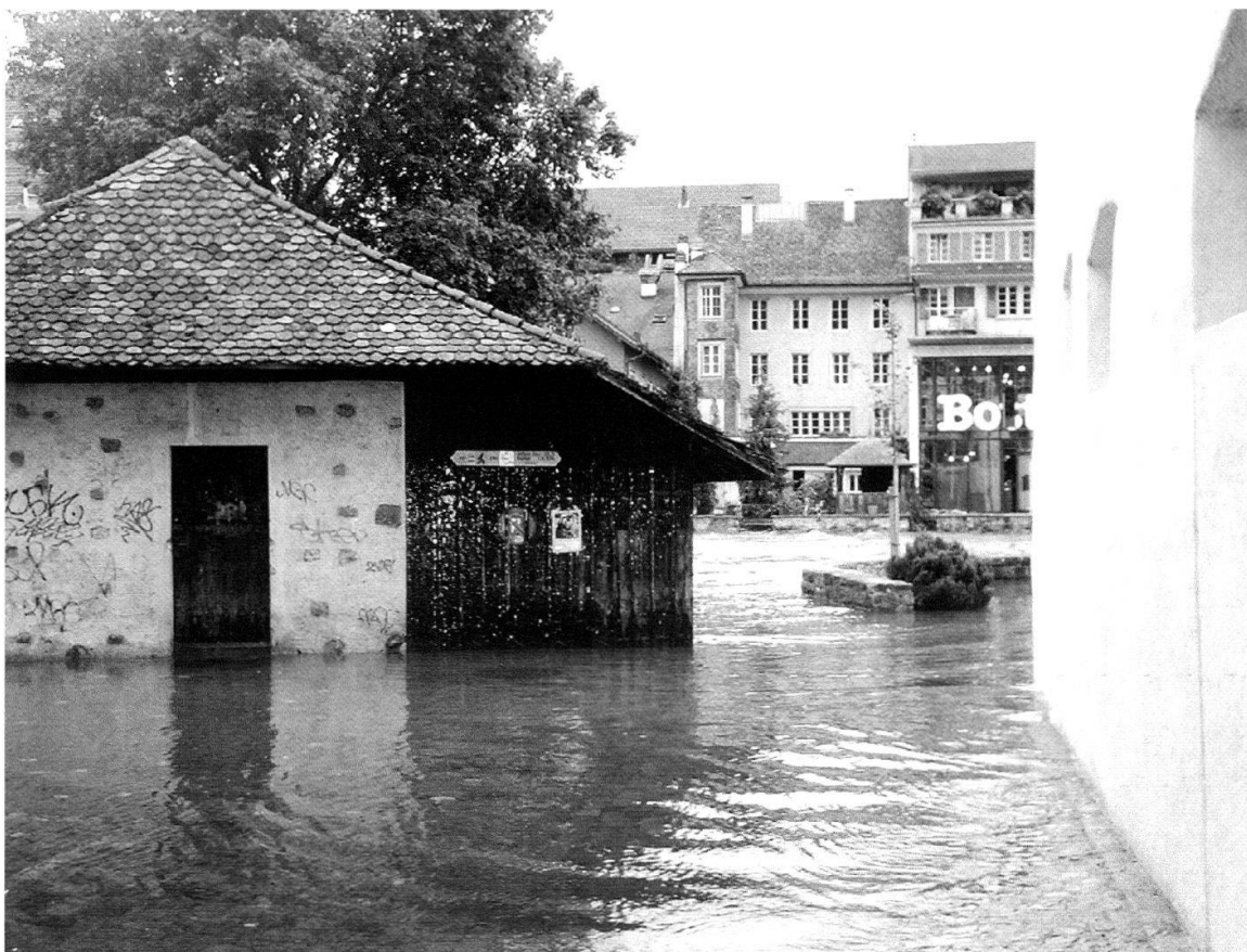
Abb. 2 Im Sommer 2005 stand Thun ein weiteres Mal unter Wasser. Der Wanderweg, der am alten Waschhaus beim Rathaus vorbeiführt, verwandelte sich in einen Wasserweg.