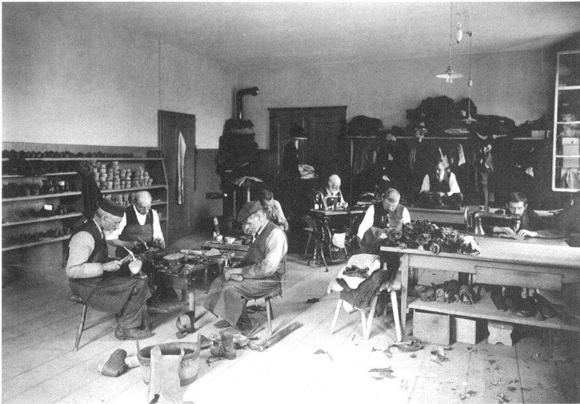
Abb. 5 Das Schusteratelier der Männer in der städtischen Armenanstalt Kühlewil. Das Bild wurde ebenfalls für die Landesausstellung von 1914 gemacht. Die männlichen Insassen mussten in der Landwirtschaft und in den Werkstätten der Anstalt mitarbeiten.

Im Februar 1887 reichten der Grütliverein, die Arbeiterpartei und der allgemeine Arbeiterverein im Berner Stadtparlament eine Petition ein, in der sie die Schaffung einer unentgeltlichen öffentlichen Arbeitsvermittlungsstelle forderten. An sie sollten sich arbeitslos gewordene Männer und Frauen wenden können, um rascher wieder eine Stelle zu finden. Der Grosse Stadtrat setzte eine Kommission ein, die das Anliegen prüfte. In einem umfassenden Bericht, in dem sie nicht nur die Situation auf dem bernischen Arbeitsmarkt analysierte, sondern auch über Erfahrungen mit Arbeitsvermittlungstellen in anderen Städten im In- und Ausland berichtete, befürwortete die Kommission die Schaffung einer städtischen Stelle für Arbeitsvermittlung und legte einen entsprechenden Vorschlag vor, den der Gemeinde- und der Stadtrat guthiessen. Zu Beginn des Jahres 1889 nahm die Anstalt für Arbeitsnachweis den Betrieb auf. Der Erfolg der neuen Einrichtung hielt sich anfänglich in engen Grenzen. Die Arbeitssuchenden nahmen dieses Angebot nur zögernd in Anspruch, und die Arbeitgeber bevorzugten die herkömmlichen Wege der Personalrekrutierung. Vor allem bei den Männern war die Vermittlungsquote mit rund einem Viertel der Stellensuchenden zudem nicht sehr hoch, während bei den Frauen auf diesem Weg immerhin etwa drei Viertel eine neue Stellen fanden. Ein Grund für die Startschwierigkeiten der Arbeitsvermittlungsanstalt war wohl auch die Tat-