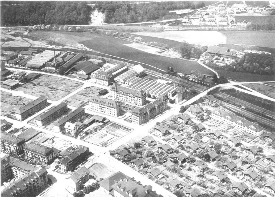
Abb. 6 Die städtische Arbeitersiedlung Wylerfeld, rechts unten im Bild zwischen Standstrasse, Scheibenstrasse und Wylerringstrasse, auf einer Luftaufnahme um 1930. Die Siedlung war ein sehr frühes Beispiel kommunalen sozialen Wohnungsbaus. Die Zweifamilienhäuser mit grossen Gärten mussten ab 1956 grossen Wohnblöcken und dem Quartierzentrum Wylerhuus weichen.