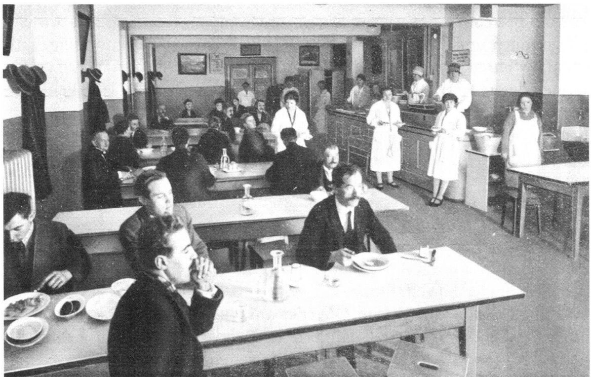
Abb. 2 Angesichts der wachsenden Not in der Stadt Bern entstanden in den 1870er- und 1880er-Jahren auch private Wohltätigkeitsinstitutionen wie die 1877 gegründete Speiseanstalt «Spysi» in der unteren Altstadt, wo den Armen warme Mahlzeiten angeboten wurden. Diese Aufnahme stammt aus dem Jahr 1928.

Auf diese Vorteile der freiwilligen Armenpfleger und -pflegerinnen wollte und konnte man in Bern auch nach 1888 nicht verzichten. Die Ge-