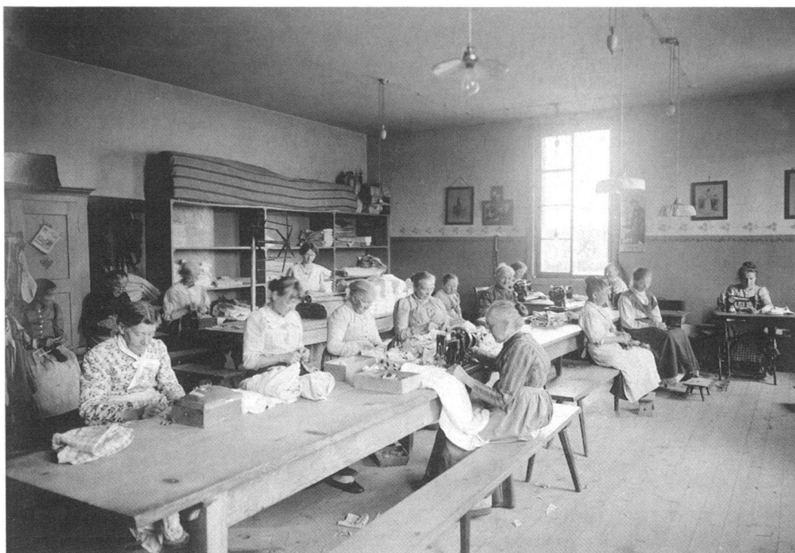
Abb. 4 Armenanstalt Kühlewil auf dem Längenberg 1914: Das Nähatelier war mit modernen Nähmaschinen ausgestattet. Die Frauen waren vor allem hier und in der Hauswirtschaft beschäftigt.

nungsjahr stieg die Zahl der Insassen auf 312 29 und nahm im nächsten Jahrzehnt noch leicht zu, auf rund 350 Personen im Jahr 1902. 30