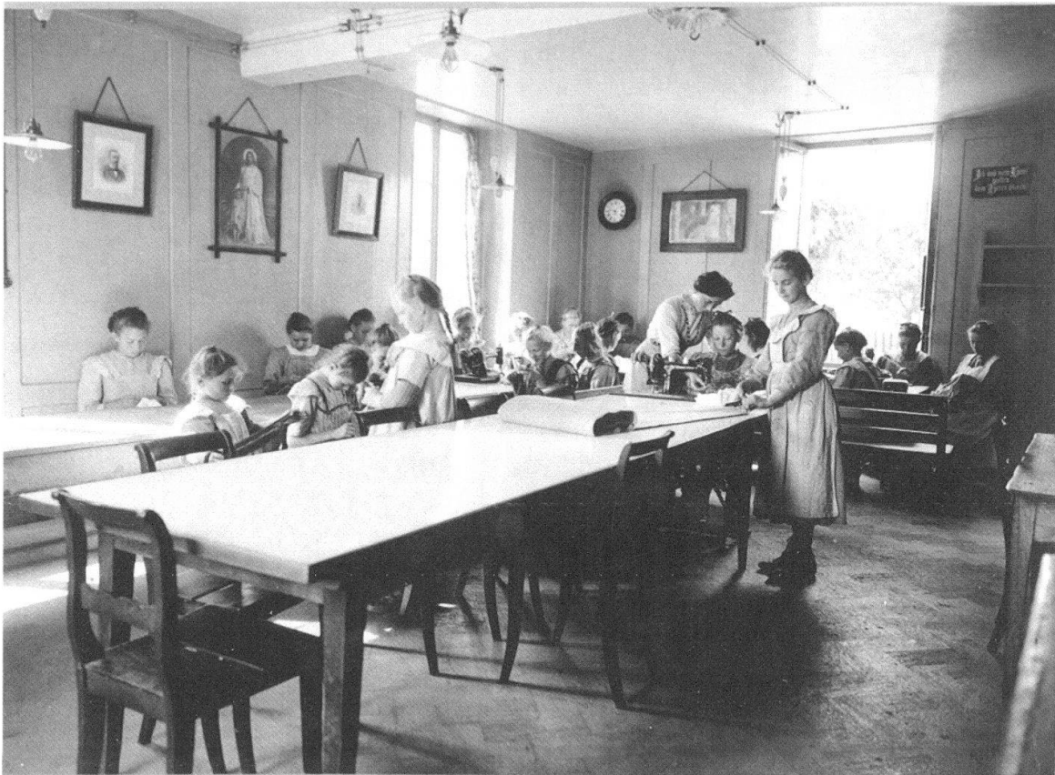
Abb. 3 Mit Stolz präsentierte der Kanton Bern an der Landesausstellung von 1914 seine Armeninstitutionen, darunter auch die Armenerziehungsanstalt für Mädchen Steinhölzli in Bern. Allerdings war die Zahl der Kinder, die in solchen Heimen lebten, relativ gering im Vergleich zu jenen, die in Pflegefamilien untergebracht wurden.

durch Naturalien und, seltener, auch durch Bargeld aus der städtischen Armenkasse unterstützt wurden. Zweitens die Verkostgeldung, das heisst die Unterbringung der verarmten Personen in einem fremden Haushalt, wobei die Armenkasse die Pflegefamilie für die Unterbringung, Pflege und Ernährung des Kostgängers oder der Kostgängerin bezahlte. Drittens die Anstaltspflege, die Unterbringung der Armen in einem Heim oder einer Armenanstalt.