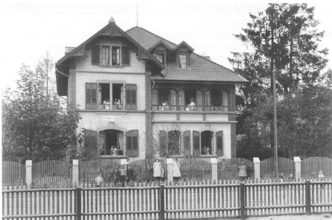
Abb. 7 Die 1880 gegründete Kinderkrippe in der Länggasse wurde ab 1898 durch die Stadt Bern subventioniert. Das vorliegende Bild stammt ebenfalls aus einem Album für die Landesausstellung von 1914.

Das Problem der Kinderbetreuung stellte sich indes nicht nur bei den Schulkindern, die in den Horten beaufsichtigt wurden, sondern mindestens ebenso dringlich bei den Kleinen, für die in den Neunzigerjahren erst vier private Krippen in der Altstadt (seit 1873), in der Lorraine (seit 1874), in der