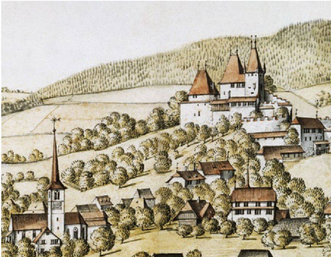
Abb. 2 Die Herrschaft Worb. Albrecht Kauw, 1669. – Historisches Museum Bern, Inv. Nr. 26091 [Ausschnitt].

(1674–1711) eine wichtige Rolle, der als Berater dafür sorgte, dass die neue Kolonie nicht in Pennsylvania, sondern in Carolina entstand.