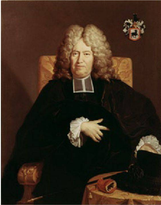
Abb. 5 Der spätere Schultheiss Johann Friedrich Willading (1641–1718) sah in der geplanten Kolonie eine Möglichkeit zur endgültigen Wegweisung der Täufer.