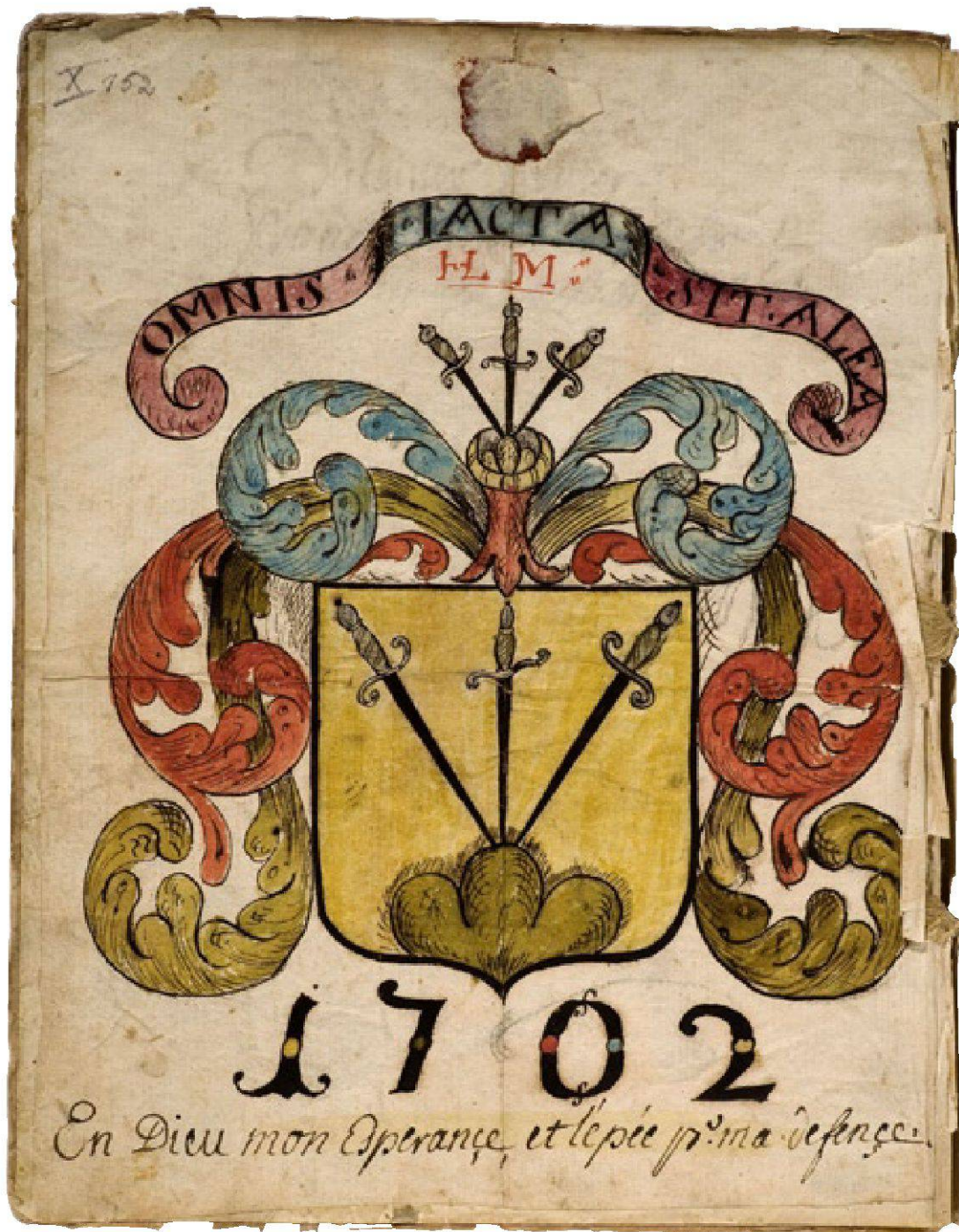
Abb. 4 Diese 1702 erschienene Reisebeschreibung weckte Christoph von Graffenrieds Interesse an den nordamerikanischen Kolonien. Meines Bruders Frantz Ludwig Michels Kurze Americanische Reißbeschreibung. – Burgerbibliothek Bern, Mss.h.b.X.152.

Christoph von Graffenried machte sich derweil im Frühjahr 1709 auf, seinen Traum von ergiebigen Minen zu verwirklichen, nachdem er sich in persönlichen Gesprächen mit Michel bestätigt gefühlt hatte. In Holland verpflichtete er holländische Minenarbeiter und -ingenieure. In London traf er