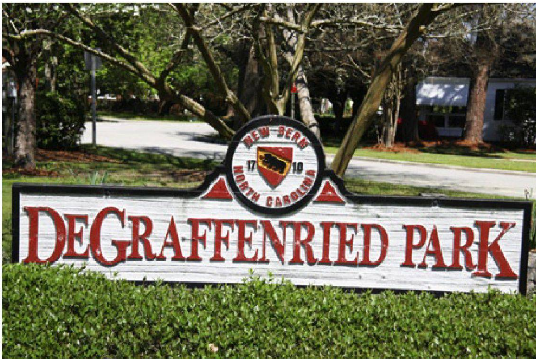
Abb. 15 Sogar ein Park erinnert an den Stadtgründer Christoph von Graffenried. – Tryon Palace Historic Sites & Gardens, New Bern.

Auch wenn die Stadt durch die Indianerkriege beinahe vollständig zerstört und der grösste Teil der Bewohner vertrieben worden war, erlebte New Bern im Verlauf des 18. Jahrhunderts nach seinem Wiederaufbau einen bemerkenswerten Aufschwung. 70 Abwechselnd mit anderen Orten wurde New Bern Hauptstadt des nördlichen Teils der Kolonie Carolina (ab 1729 North Carolina). 1766 machte der königliche Gouverneur William Tryon New Bern definitiv zur Kapitale der Kolonie und liess in den folgenden Jahren den heute noch bestehenden Tryon Palace erbauen. Im Sezessionskrieg spielte New Bern nur eine untergeordnete Rolle, auch wenn North Carolina in