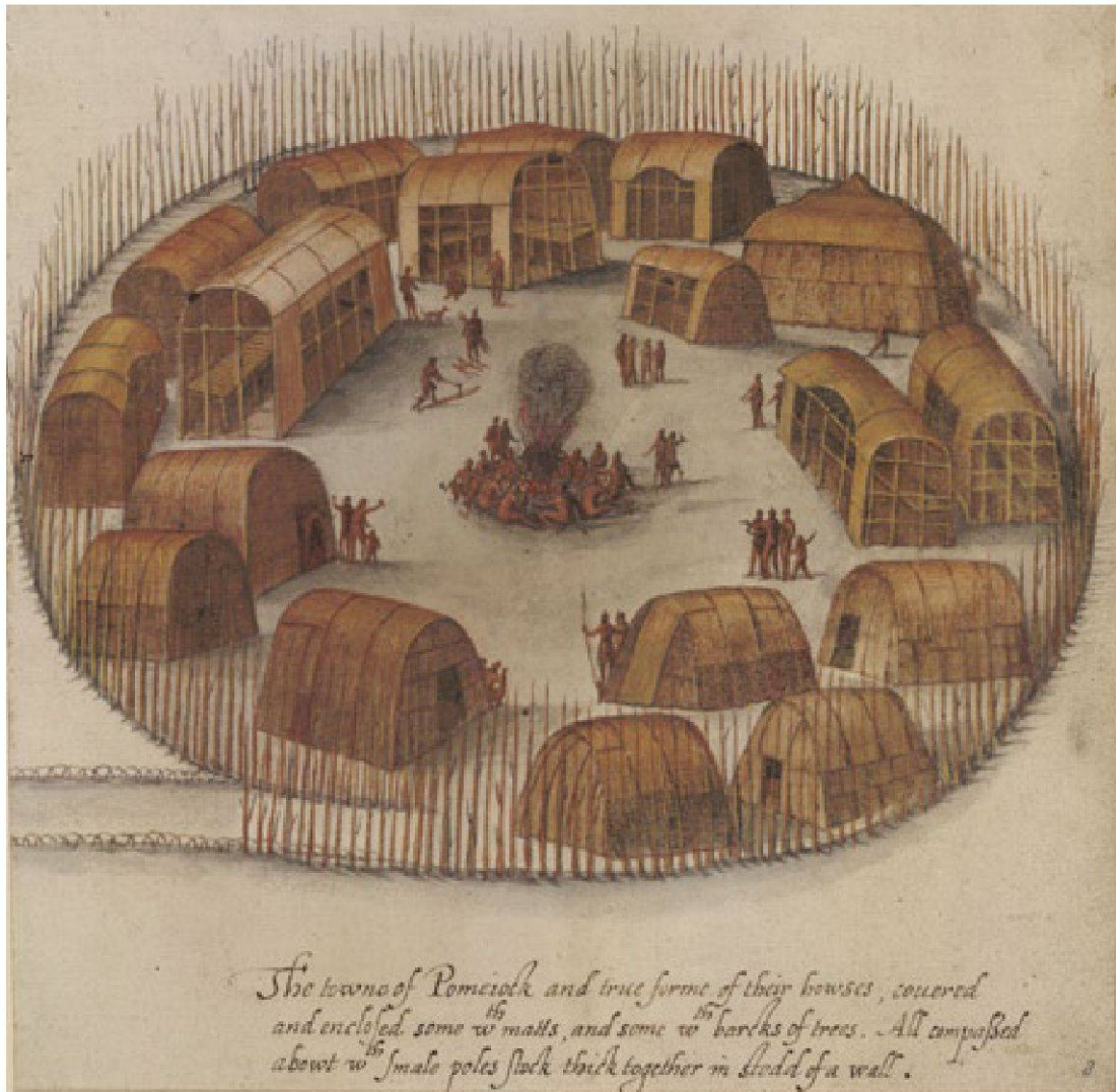
Abb. 14 Indian Village of Pomeiooc (1585), Zeichnung von John White (ca. 1540–ca. 1593). – British Museum London, Col-P09-b2.

«The Indians of North-Carolina are a well-shap'd clean-made People, of different statures, as the Europeans are, yet chiefly inclin'd to be tall. They are a very streight People, and never bend forwards, or stoop in the Shoulders, unless much overpower'd by old Age. Their Limbs are exceeding well-shap'd. As for their Legs and Feet, they are generally the handsomest in the World.» 67