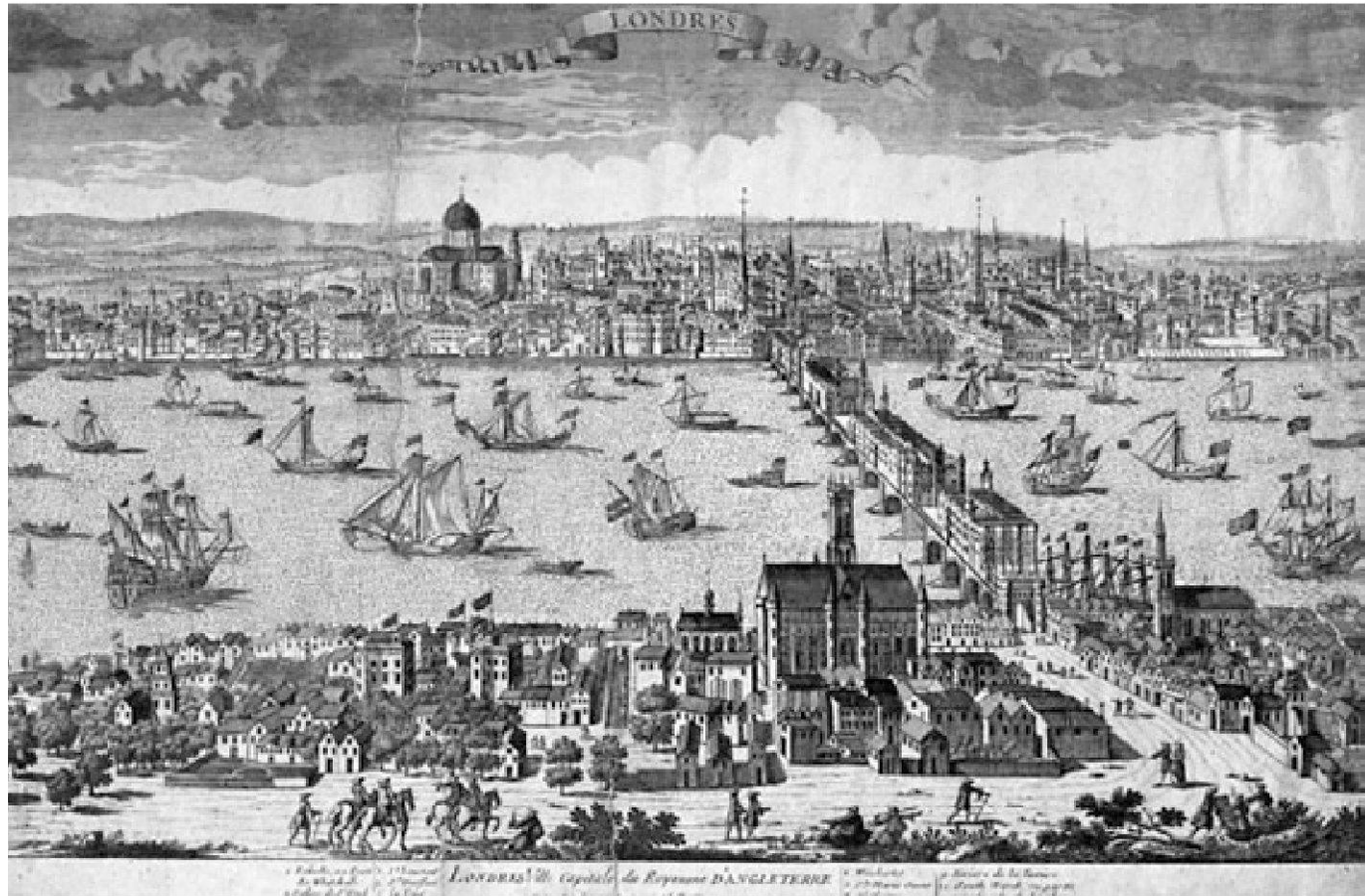
Abb. 8 London um 1700. – The Bridgeman Art Library, Nr. 55994666 [Ausschnitt].

ried, Michel und Ritter, der wohl mit Michel nach London gekommen war, 56 am 18. Mai 1710 den endgültigen «Handlungs-Contract». 57 Am 11. Juli schliesslich waren alle Vorbereitungen abgeschlossen, und die mittlerweile 102 Personen stachen als zweite Expedition in See. Bis zur Abfahrt waren bereits sechs Personen gestorben. Christoph von Graffenried und sein ältester Sohn Christoph (1691–1744) 58 schlossen sich der Gruppe an. Da es damals noch keine hochseetauglichen Passagierschiffe gab, dürften für die Überfahrt umgebaute Handelsschiffe gedient haben, die allerdings mit Kanonen bewaffnet waren. Der spanische Erbfolgekrieg war in vollem Gange und neben Freibeutern waren auch Piraten eine ständige Gefahr, was bereits die erste Reisegruppe schmerzlich hatte erfahren müssen. Auf den Schaluppen waren keine Kabinen vorhanden, bloss Schlafgelegenheiten und Klappische. 59 Es scheint sich also um eine Art Massenlager gehandelt zu haben. Die Qualität der Verpflegung war dürftig, viele Lebensmittel waren schon nach ein bis zwei Wochen verdorben. Besser hatten es nur jene Passagiere, die sich selbst ausgerüstet hatten. 60