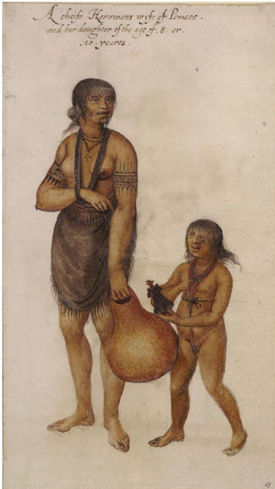
Abb. 13 John White (ca. 1540–ca. 1593) zeichnete bereits im 16. Jahrhundert die Indianer Carolinas. Indian Woman of Pomeiooc, with Child and Doll (ca. 1585). – British Museum London, Col-P09-e1.