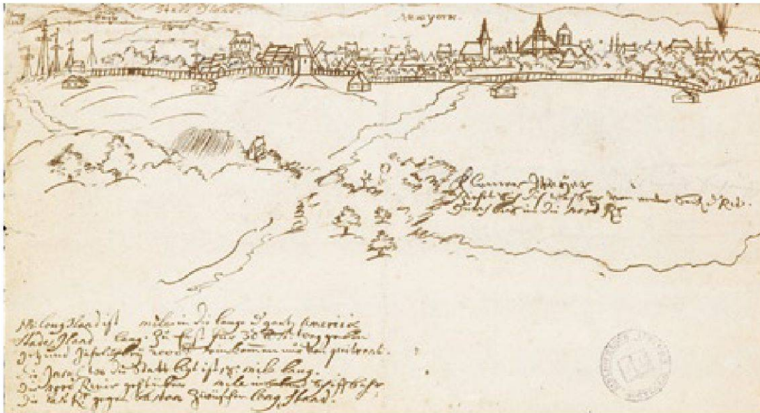
Abb. 11 Bei seiner Rückkehr nach Bern kam von Graffenried 1714 auch in New York vorbei, wo er eine der ersten Zeichnungen der Stadt anfertigte.

nicht in ihrem Fisch- und Jagdrecht eingeschränkt würden. Schliesslich wurde zugesichert, dass sich die Kolonie in Auseinandersetzungen der Indianer mit den Briten künftig neutral verhalten würde. 64 Während der Gefangenschaft von Graffenrieds fanden jedoch Angriffe der Indianer auf New Bern statt. Viele Einwohner kamen um oder wurden vertrieben, und das Städtchen wurde weitgehend zerstört. 65