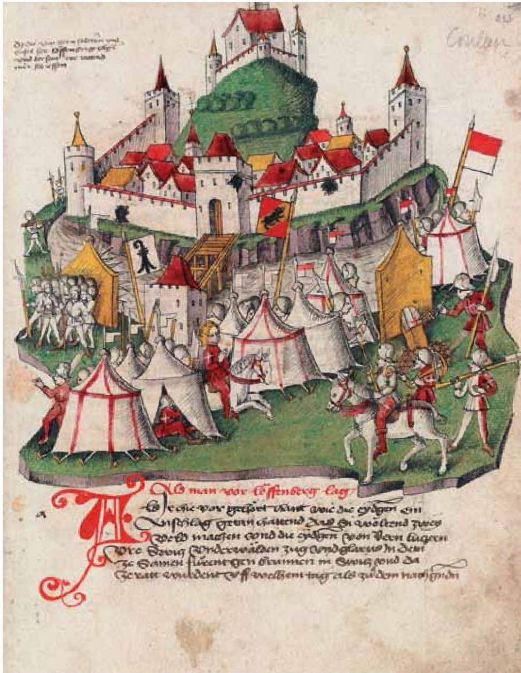
Laufenburg wird im August 1443 von Berner Truppen und Kontingenten aus den verbündeten Städten Basel und Solothurn belagert. – Bendicht Tschachtlan: Bilderchronik (um 1470), Zentralbibliothek Zürich, Ms. A 120, S. 813.