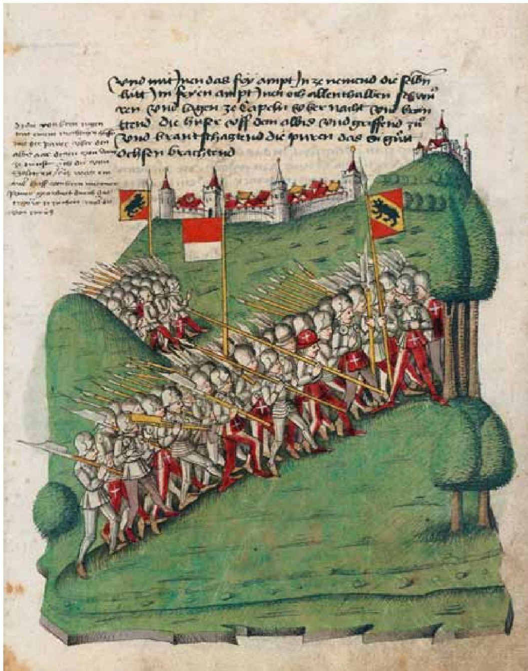
Bern unterstützt im November 1440 Schwyz mit Truppen. Ein Teil der Berner und der verbündeten Solothurner zieht über den Albis zu den Schwyzern, der andere über Mellingen in die Zürcher Landschaft. – Benedict Tschachtlan: Bilderchronik (um 1470), Zentralbibliothek Zürich, Ms. A 120, S. 699.