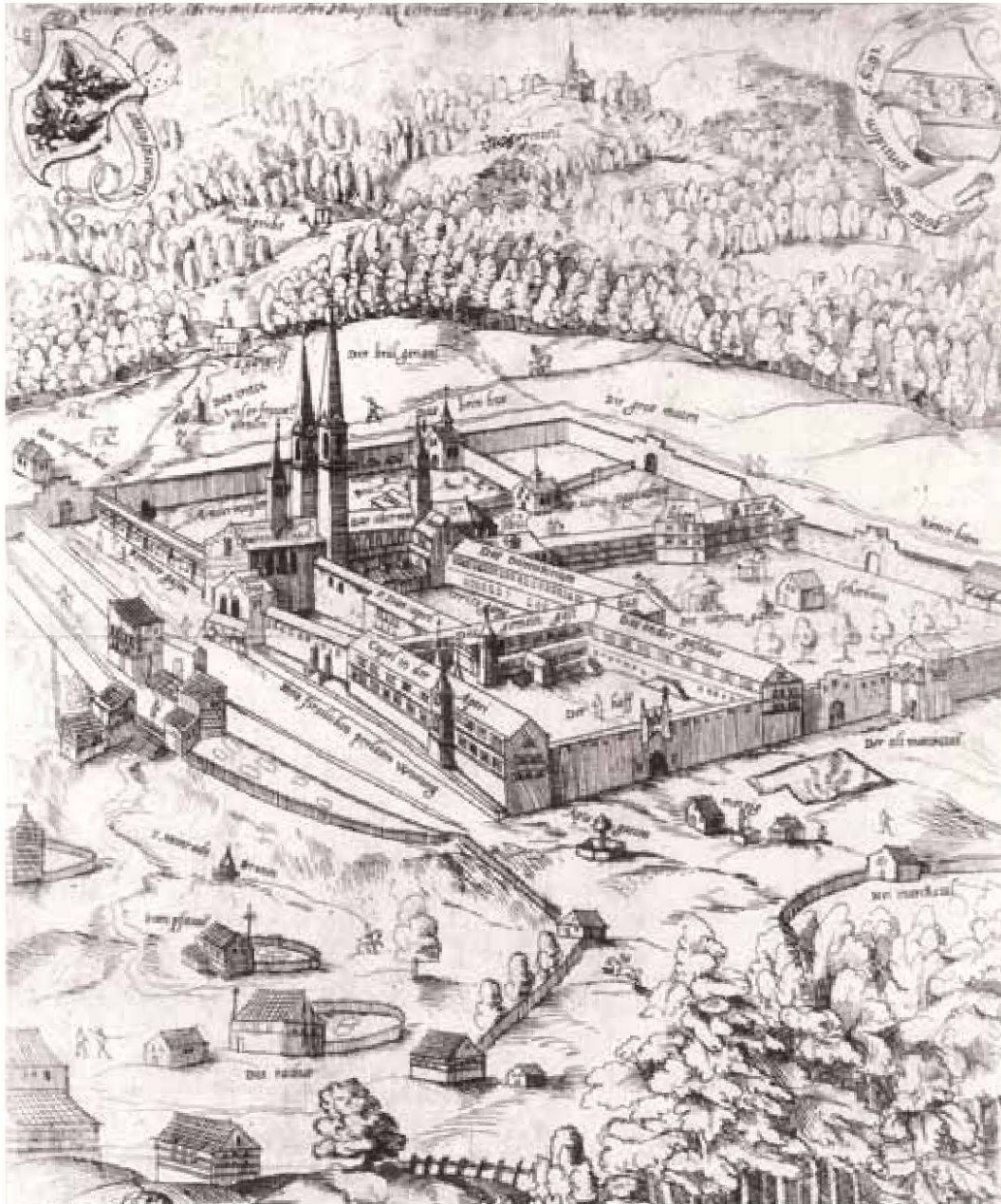
Hinter dem Kloster Einsiedeln befindet sich die Brüel-Matte, auf der am 24. August 1450 die Boten der eidgenössischen Orte die alten Bünde neu beschworen haben. – Heinrich Stacker: Klosteranlage Einsiedeln von SW, Kupferstich 1593. – Kupferstichkabinett Kunstmuseum Basel.