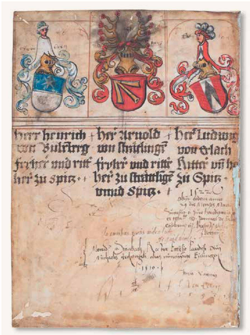
Titelseite der Strättlinger Chronik mit zahlreichen Benutzernamen. Die Schilde der Bubenberg und von Erlach neigen sich dem Wappen des Gründervaters Arnold von Strättlingen zu. – Um 1519/22, Tinte auf Pergament. Staatsarchiv Bern, B III 40.