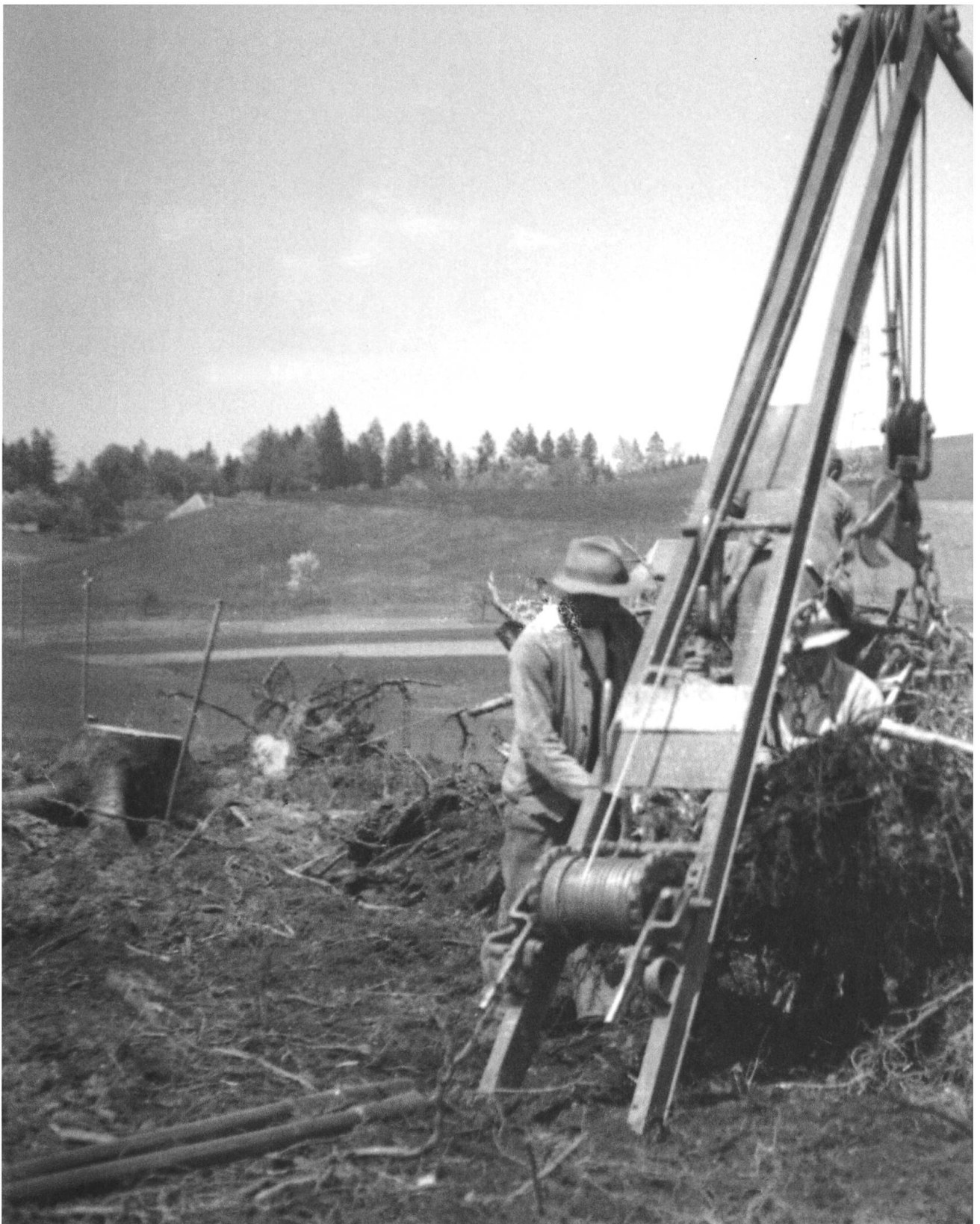
Rodung Kühwald Dürrenroth, Mai 1944. Flaschenzug zum Ausreißen des Wurzelstocks. Die Zugkraft lieferte eine Motorseilwinde. Trotz des Einsatzes von technischen Mitteln war bei Rodungen immer noch viel Handarbeit nötig, beispielsweise das Abschlagen der Wurzeln oder das Säubern der Rodungsflächen. Die Kosten der Rodung des Kühwaldes waren mit 6370 Franken pro Hektar überdurchschnittlich hoch.