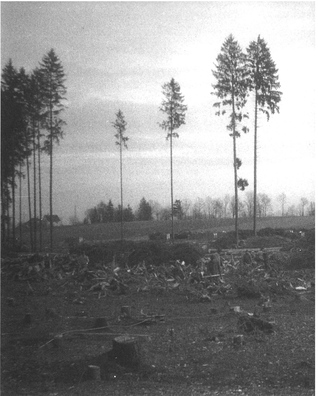
Rodung Pfrundwald, Gemeinde Bätterkinden, Februar 1946. Der Regierungsrat verfügte am 24. Dezember 1943 die Rodung von 14 Hektaren im staats-eigenen Pfrundwald. Das neu gewonnene Kulturland konnte in den Perimeter der Güterzusammenlegung Bätterkinden einbezogen werden. Wie andern-orts gab es in der Bevölkerung Bedenken gegen die Beseitigung des Waldes als Windschutz.