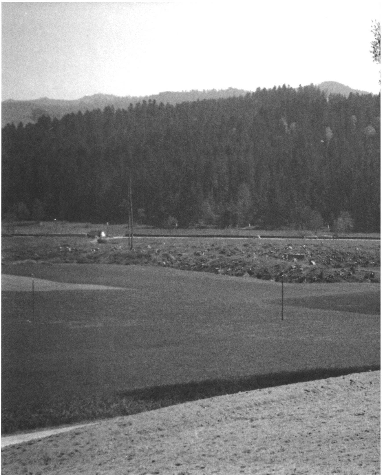
Rodungsfläche des Kühwaldes, Gemeinde Dürrenroth, Mai 1944. Während der Anbauschlacht konnten kleinere Rodungen durch die Waldeigentümer selbst durchgeführt werden, grössere Rodungsarbeiten wurden an Bauunternehmer vergeben. Die Rodung des Kühwaldes übernahm das Baugeschäft Reinhardt & Cie. in Sumiswald. Die Holzverwertung organisierten die Waldeigentümer. Das Holz konnte an Ort und Stelle auf die Bahn verladen und abtransportiert werden.