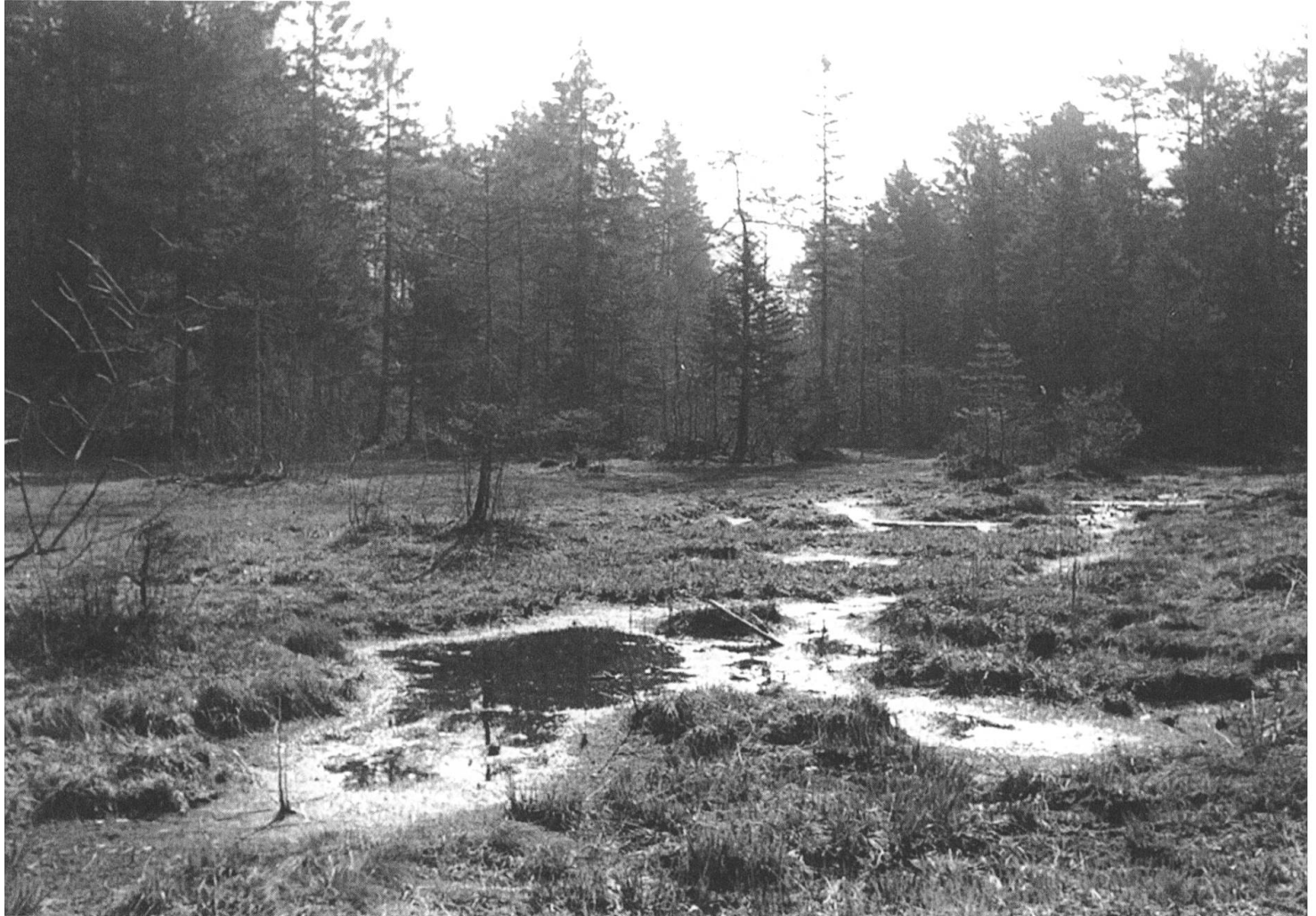
Seeliswald, Gemeinde Reutigen, vorderes Moor gegen Osten, April 1943. Das Hochmoor im Seeliswald wurde vom Regierungsrat am 5. Mai 1944 provisorisch unter Schutz gestellt. Ein Rodungs- und Entwässerungsprojekt der Burgergemeinde Reutigen konnte deshalb nicht ausgeführt werden. Am 20. Februar 1945 hob der Regierungsrat unter dem Eindruck des Rückstands im Rodungsprogramm den Schutz wieder auf und bewilligte – unberechtigterweise – die Melioration. Für die Bewilligung dieser knapp sieben Hektaren grossen Rodung im Schutzwaldgebiet war nämlich das Eidgenössische Departement des Innern zuständig. Naturschutzkreise wollten das Hochmoor dauerhaft unter Schutz stellen. Nach einer Begutachtung durch die Eidgenössische Natur- und Heimatschutzkommission lehnte das Eidgenössische Departement des Innern eine Rodung aus Naturschutzgründen endgültig ab. Seit 1946 steht das Hochmoor wieder unter Naturschutz. Heute umfasst das 28 Hektaren grosse Naturschutzgebiet den gesamten in der Gemeinde Reutigen liegenden Seeliswald. – BAR, E 3270 A 1000 760 49.