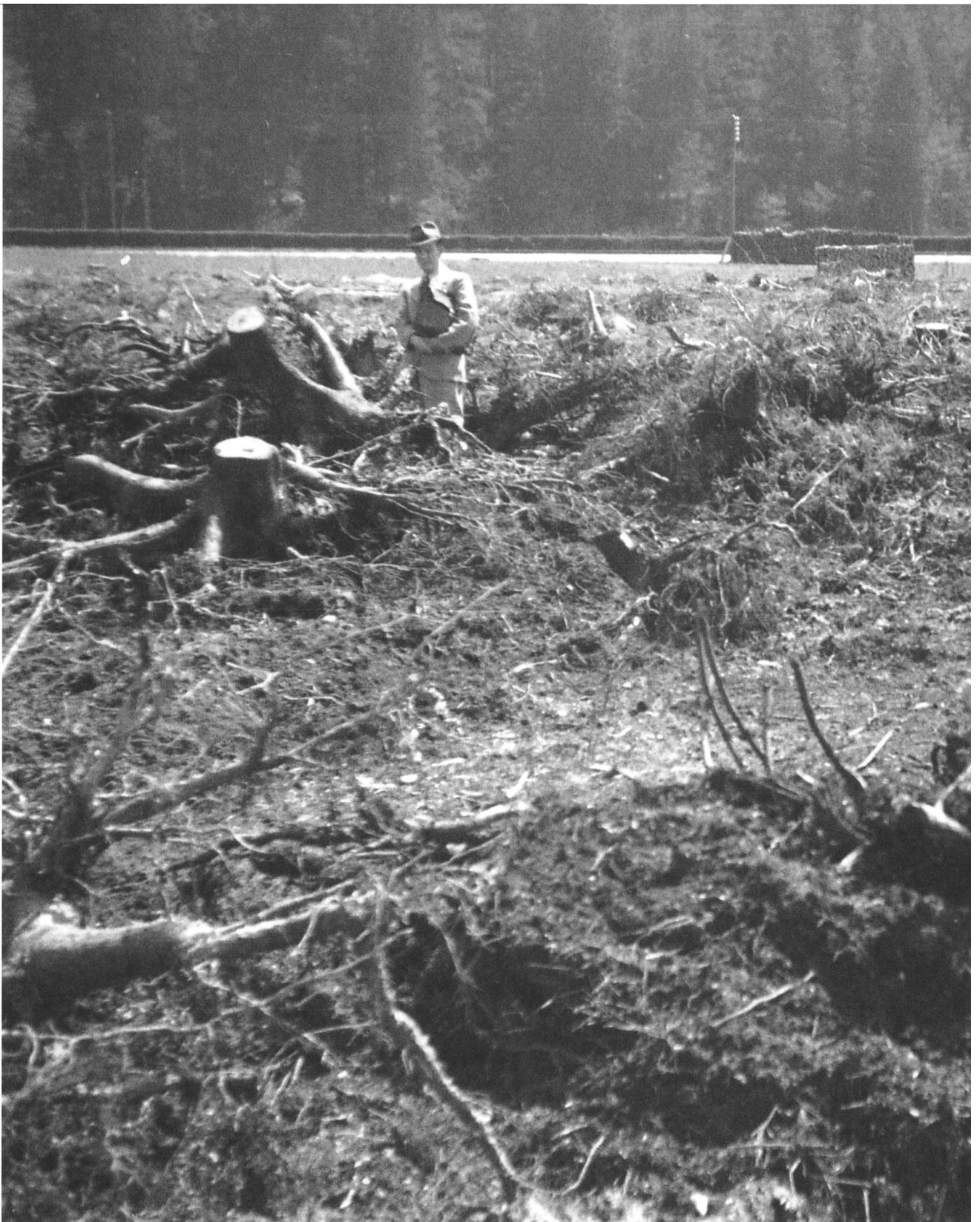
Rodungsfläche des Kühwaldes, Gemeinde Dürrenroth, Mai 1944. Blick in südliche Richtung. Im Hintergrund, vor dem Wald, verläuft die Eisenbahnlinie Huttwil–Sumiswald. Im Süden grenzte der Kühwald an die Staatsstrasse, sonst war er von Kulturland umgeben. Die Rodung des sechs Hektaren grossen Nadelholzwaldes war ein Teil der Melioration Waltrigenmoos, die zwischen 1943 und 1951 in den Gemeinden Affoltern, Dürrenroth und Walterswil durchgeführt wurde.