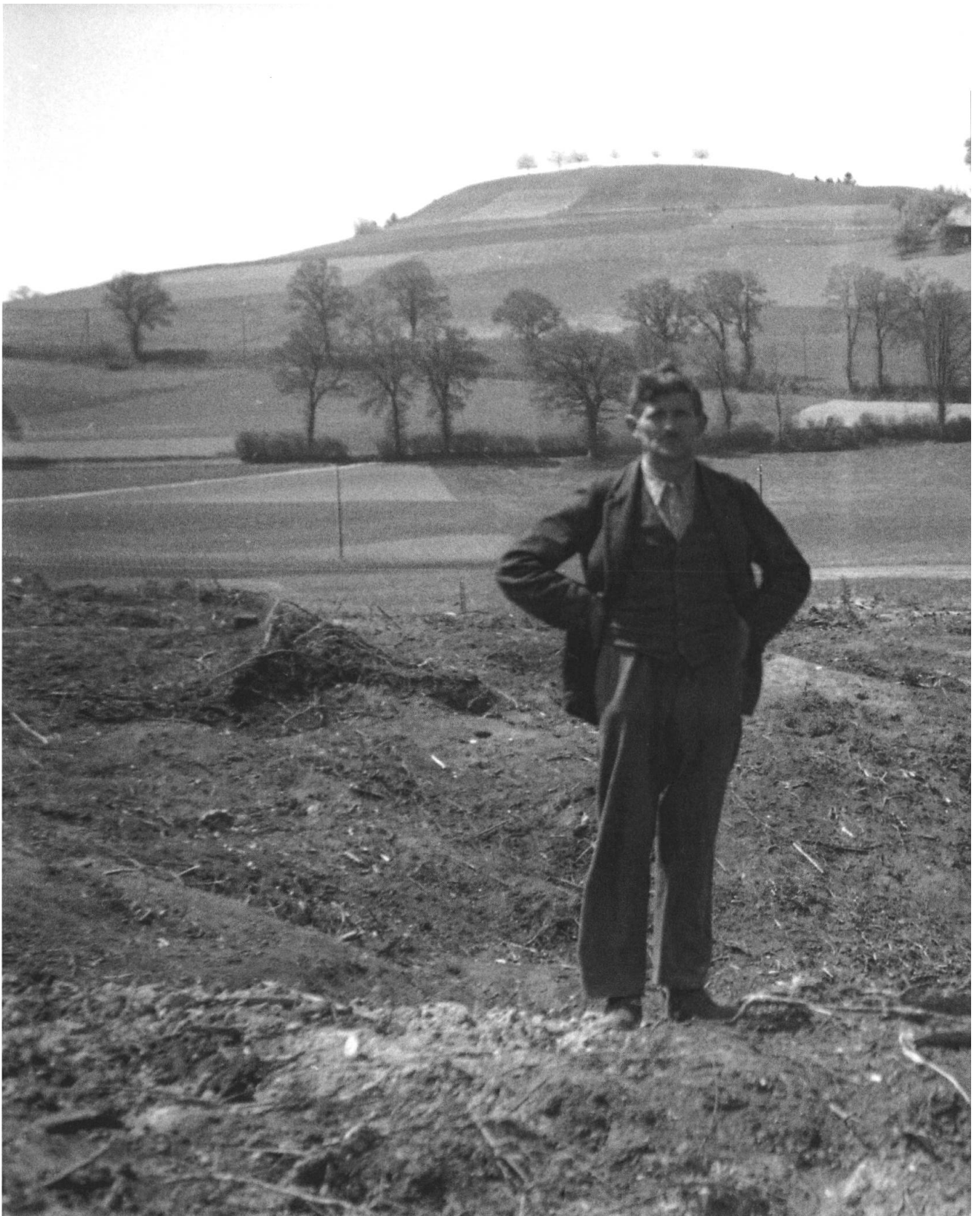
Rodung Kühwald Dürrenroth, Mai 1944. Rodungsfläche nach dem Entfernen der Wurzelstöcke. Nach einer gründlichen Säuberung der Fläche durch Hilfsmannschaften musste der Boden mit einem Bagger planiert werden, bevor er unter den Pflug genommen werden konnte.