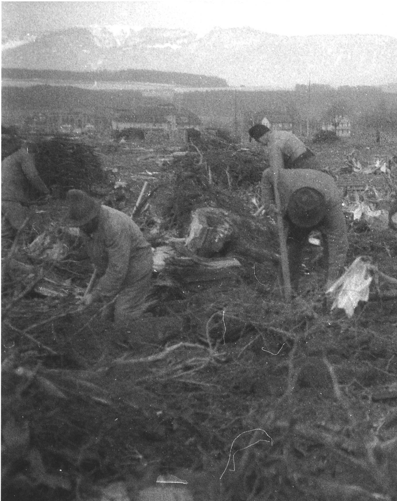
Rodung Pfrundwald, Gemeinde Bätterkinden, Februar 1946. Der Kanton Bern verkaufte 1946 den Boden des ehemaligen Staatswaldes einem Landwirt aus Bätterkinden mit der Verpflichtung, im Rahmen der Güterzusammenlegung eine landwirtschaftliche Siedlung zu errichten. Das Rodungsland wurde mit einem Bauverbot belastet, um Bodenspekulation zu verhindern. Vor dem Hintergrund des Siedlungswachstums in Bätterkinden gab der Regierungsrat das Rodungsland 1962 zur Überbauung frei. Die für die Rodung geleisteten Bundes- und Kantonssubventionen mussten aber zurückbezahlt werden.