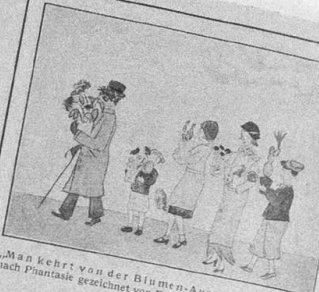
„Man kehrt von der Blumen-Ausstellung zurück“ nach Phantasie gezeichnet von Rudi Lehmann (13 Jahre), Bern.