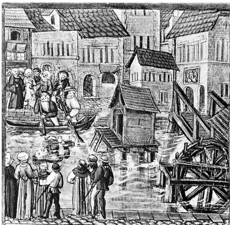
Abb. 1 Dachlandschaft (mit verschiedenen Deckmaterialien) in der Stadt Zürich im 16. Jh.

Sicher trifft das für Niklaus Kung zu, der 1416 das Bürgerrecht erhielt und mit der Ziegelhütte belehnt wurde (4). Kung schwur einen Eid, die Ziegelhütte in gutem Zustand zu bewahren und den Lehm – den «herd» – jeweils im Winter zu graben und herbeizuführen. Es wurde ihm vorgeschrieben, zu welchem Preis er Ziegel und Kalk den «unsern» liefern sollte. Diese Preise waren offenbar kostendeckend angesetzt und Kung hatte dabei sein Auskommen. Weder warf der Betrieb einen hohen Gewinn ab, von dem die Stadt einen Teil als Pachtzins beanspruchte, noch musste dem Ziegler ein Ausgleich für künstlich tiefgehal-