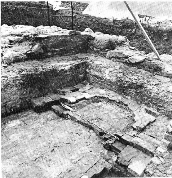
Abb. 4 Im Stadtquartier Witikon 1980/81 entdeckter Ziegelbrennofen aus dem 16./17. Jh.

Gorius Keller, einer seiner Nachfolger, bat 1581 um Erhöhung des Tarifes, der unter demjenigen für selbständige Ziegler lag, oder um Erhöhung der Besoldung. Den Tarif mochte der Rat nicht ändern, gewährte aber zusätzliche neun Mütt Kernen, sodass Keller nun im Jahr auf 25 Mütt (2070 l/1350 kg) Kernen kam (13).