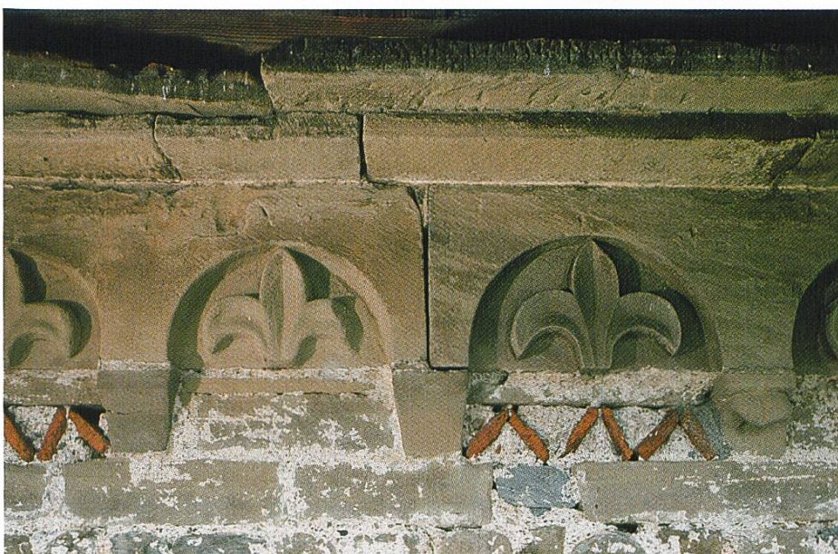
unten: Rüeggisberg BE, ehemaliges Cluniazenser- priorat, Backsteindekor um 1100.