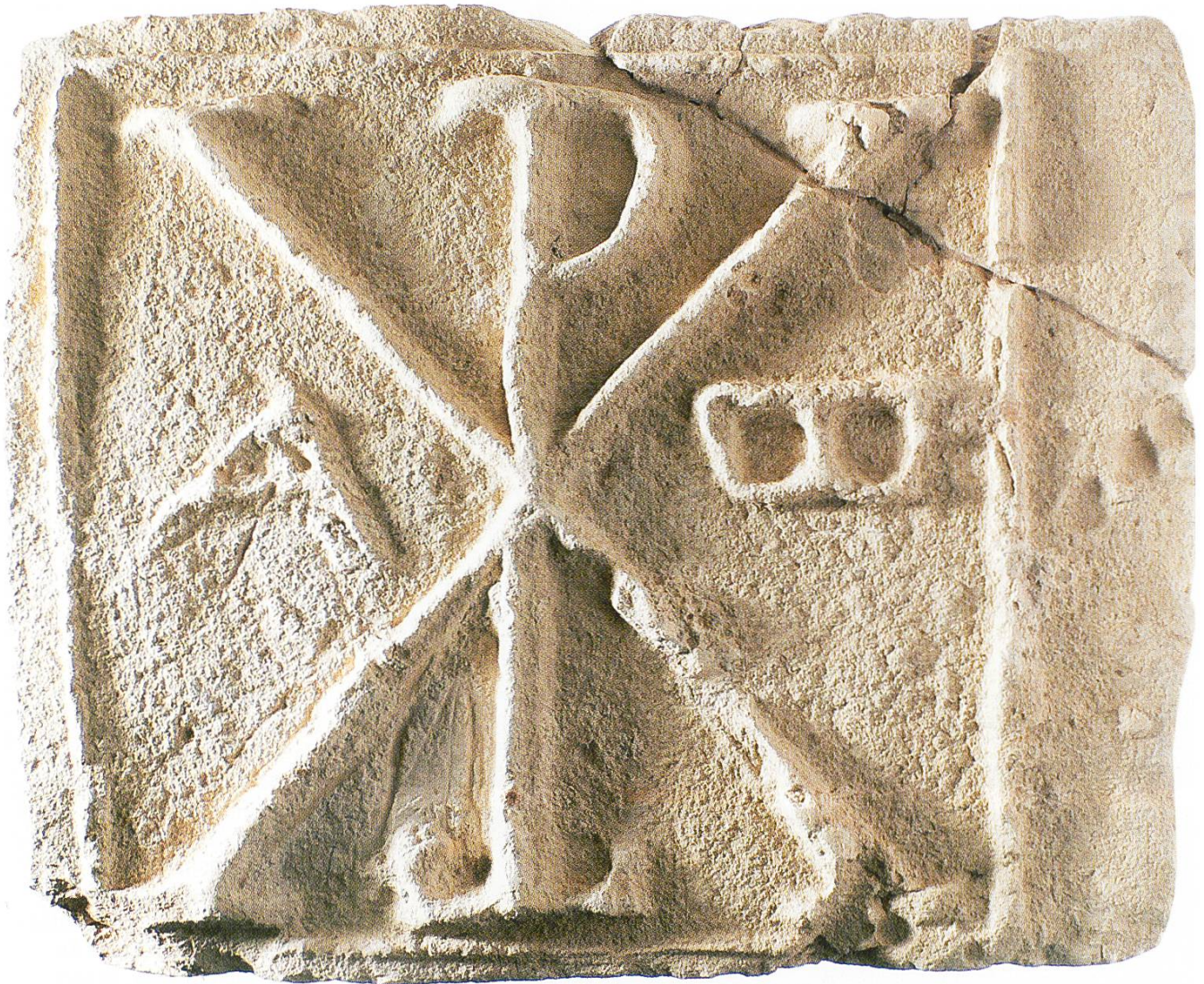
Wandfliese ZM 8299: Breite 37 cm, Höhe 30,5 cm, Dicke 3,5 cm. Zusammen mit dem überstehenden Relief ergibt sich eine Stärke von 4,3 bis 4,9 cm; unmasstäblich.