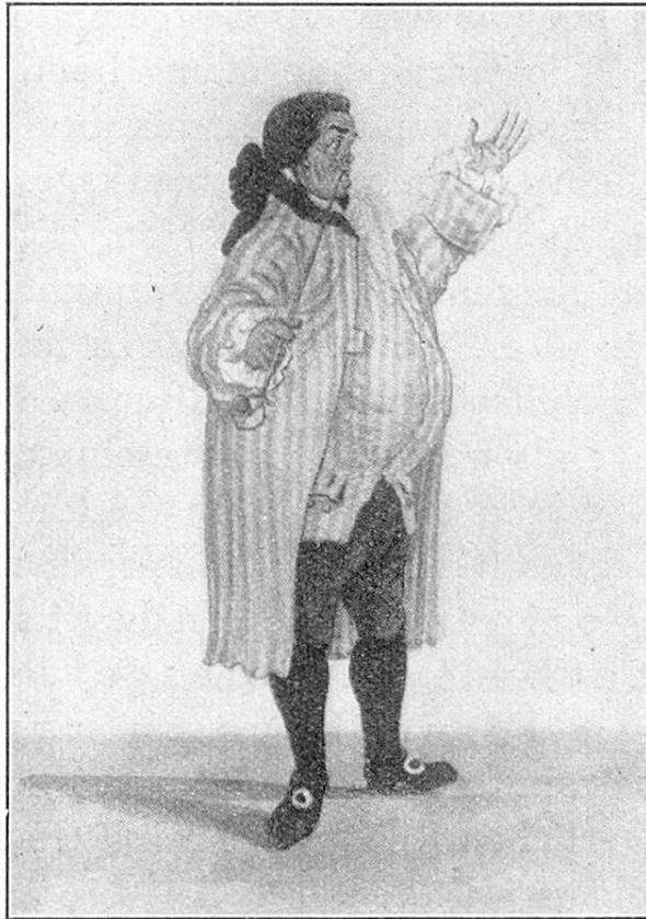
Ein Spitalmeister des 18. Jahrhunderts. Un directeur d'hôpital du 18me siècle.

noch ein enges Beisammenwohnen von heilbaren und unheilbaren, ansteckenden und nichtansteckenden Kranken, von Männern und Frauen aus bessern und geringeren Verhältnissen. Erst die Verlegung des Bürgerspitals an seinen jetzigen Standort brachte eine Scheidung der Pfrundanstalt und der Krankenanstalt in je besondere Gebäude, wenn auch immer noch auf dem gleichen Gelände und un-